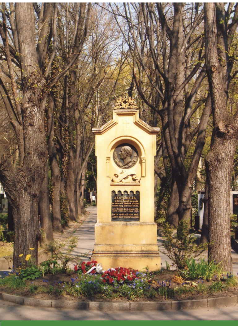
Náhrobný pomník Jána Kollára na Olšanských hřbitovoch v Prahe, apríl 2007

Sme radi, že sme mohli predstaviť rozsiahlu a rôznorodú obrazovú zbierku Jána Kollára, osobnosti, ktorá