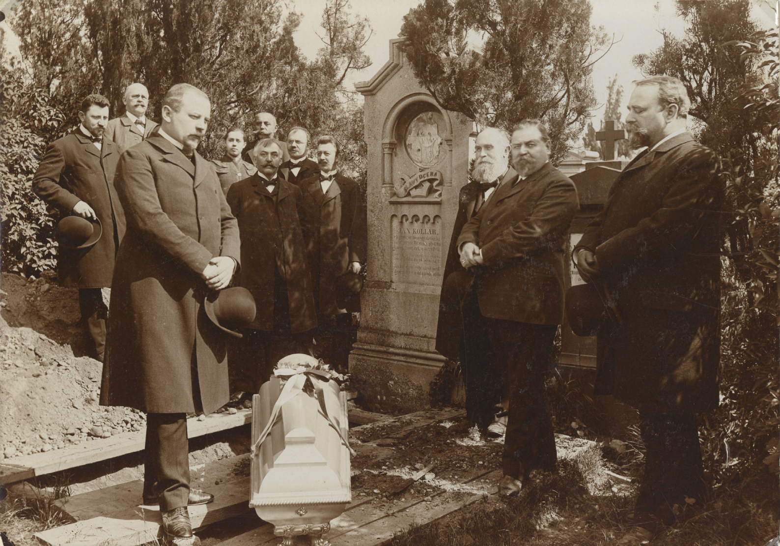
Exhumácia telesných pozostatkov Jána Kollára na Cintoríne sv. Marka vo Viedni, 14. 5. 1904