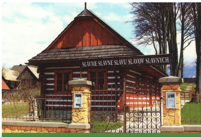
Obr. 1 Pamätná tabuľa nad vchodom do dvora v Mošovciach, kde stál rodný dom Jána Kollára, 2012 (Slovenská národná knižnica – Literárny archív, ďalej len SNK – LA)

starším záberom radíme fotografiu významného fotografa Pavla Socháňa zo slávnosti 100. výročia narodenia Jána Kollára, ktorá sa konala na mieste rodného domu v auguste 1893. Sypáreň od roku 1974 slúžila ako malá pamätná izba venovaná životu a dielu bás-