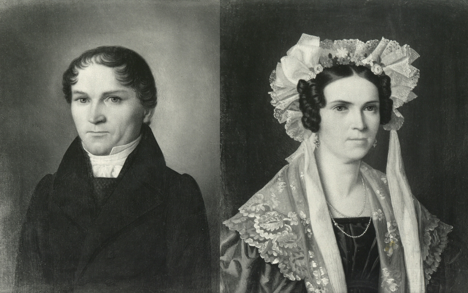
Podobizeň Jána Kollára a jeho manželky pri sobáši, 1835