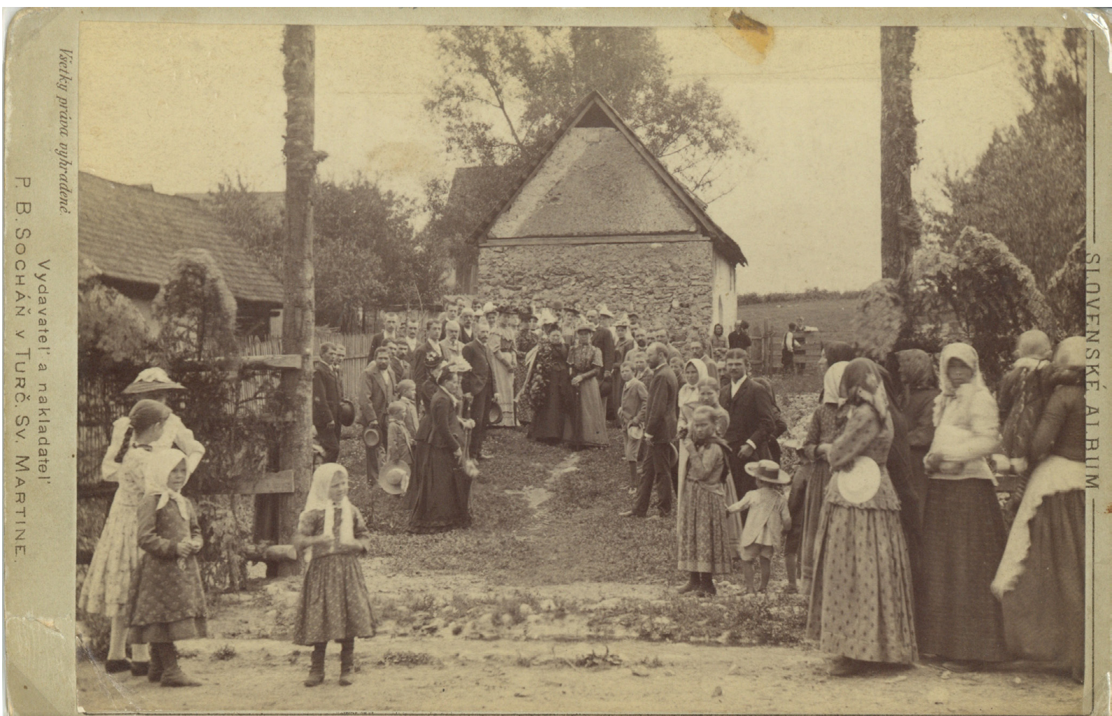
Slávnosť 100. výročia narodenia Jána Kollára na mieste rodného domu