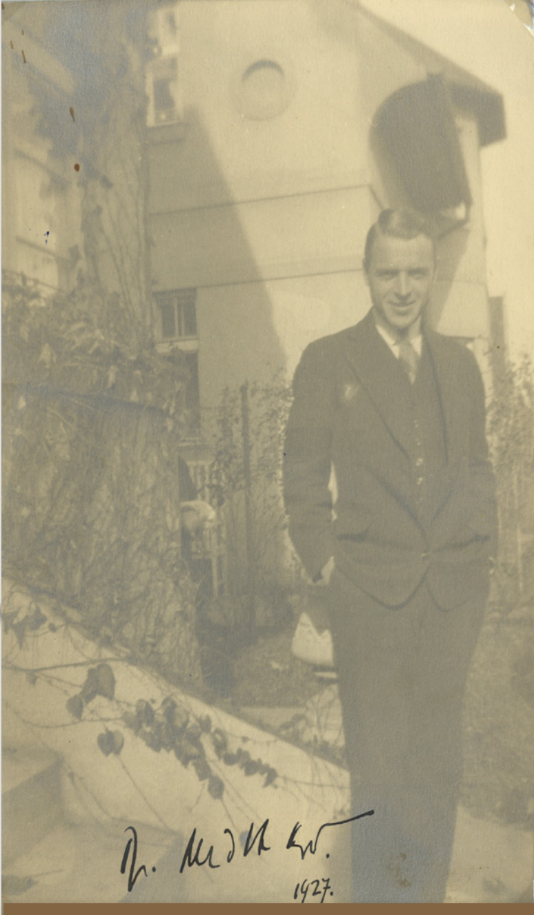
Obr. 7 Gregor Medvecký, 1927