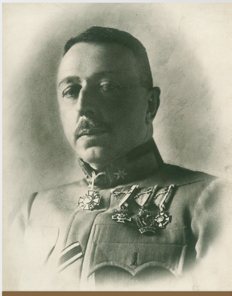
Obr. 6 Generálmajor Ladislaus Jony, 1915 (Čarnogurská a Szabó 2023)