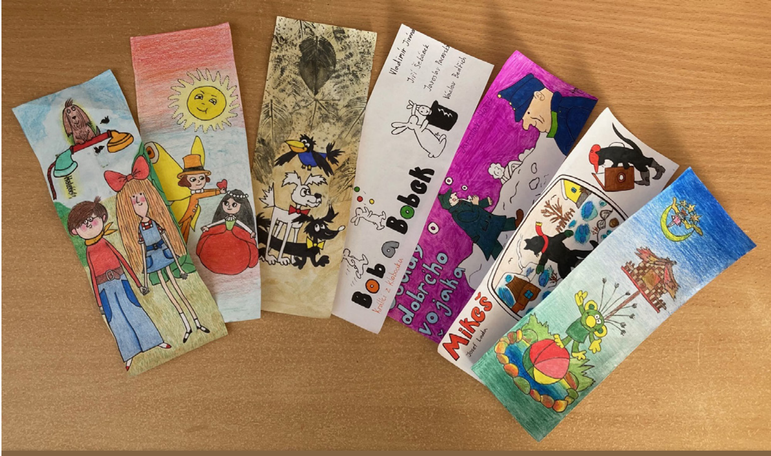
Záložky žiakov ZŠ Ježov, ČR