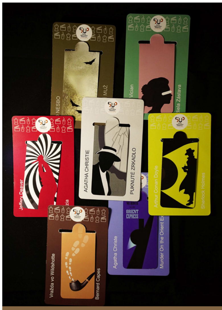
Záložky študentov Školy umeleckého priemyslu vo Svidníku

Národný inštitút vzdelávania a mládeže vytvoril 86 partnerských dvojíc z prihlásených stredných škôl, pričom vždy prihliadal na typ školy a počet prihlásených žiakov. Začiatkom októbra zaslal každej partnerskej dvojici kontaktné údaje spolu s podrobnými doplňujúcimi informáciami o realizácii celoslovenského projektu. V priebehu októbra im posielal dôležité informácie a pokyny. Termín ukončenia výmeny záložiek stanovil na 31. október 2023 a termín zaslania dobrovoľného vyhodnotenia z priebehu celoslovenského projektu na 16. november 2023.