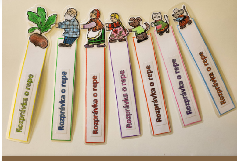
Záložky žiakov ZŠ Vysoká nad Uhom

Národný inštitút vzdelávania a mládeže vytvoril koncom septembra 2023 na základe spracovaných údajov z elektronických prihlášok 590 partnerských dvojíc s prihliadnutím na typ a druh školy (napr. základná škola, špeciálna škola, málotriedka, osemročné gymnázium), stupeň zapojenia žiakov zo základnej školy (napr. len 1. stupeň, len 2. stupeň, spolu 1. a 2. stupeň), na počet prihlásených žiakov a vopred dohodnuté partnerstvo medzi dvoma školami. Následne zaslal kontaktné údaje každej partnerskej dvojici spolu s podrobnými doplňujúcimi informáciami