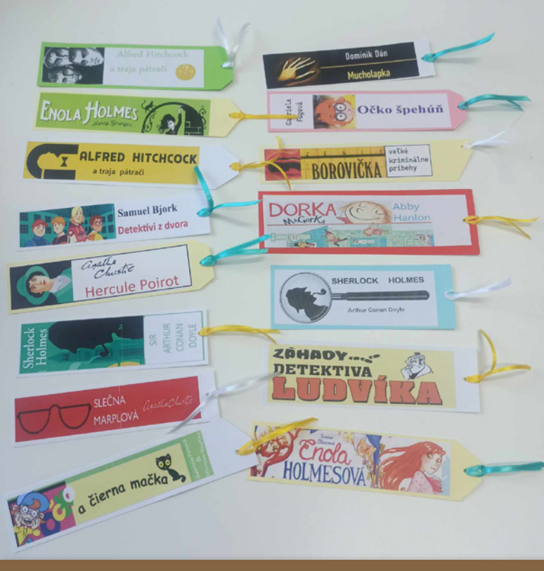
Záložky študentov Spojenej školy internátnej v Snine