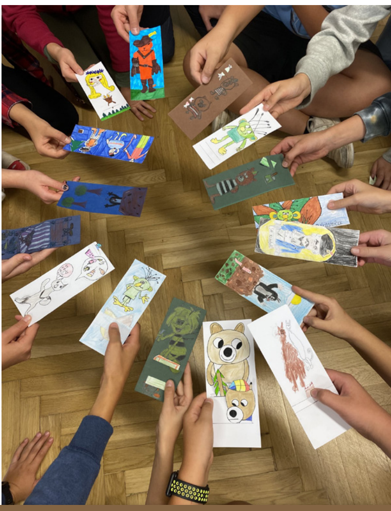
Záložky žiakov ZŠ CH. G. Masarykovej Lány, ČR (Archív NIVaM)

krúžkov, v školskej družine alebo v školskej knižnici. Najmenší žiaci zobrazovali literárne motívy z ľudových rozprávok, detských komiksov a večerníčkov. Starší žiaci boli prevažne ovplyvnení knihami, ktoré aktuálne čítali alebo ktoré prečítali v minulosti a ich očarili. Mladší gymnazisti pracovali s klasickou českou, slovenskou a svetovou literatúrou a súčasnou literatúrou pre deti a mládež.