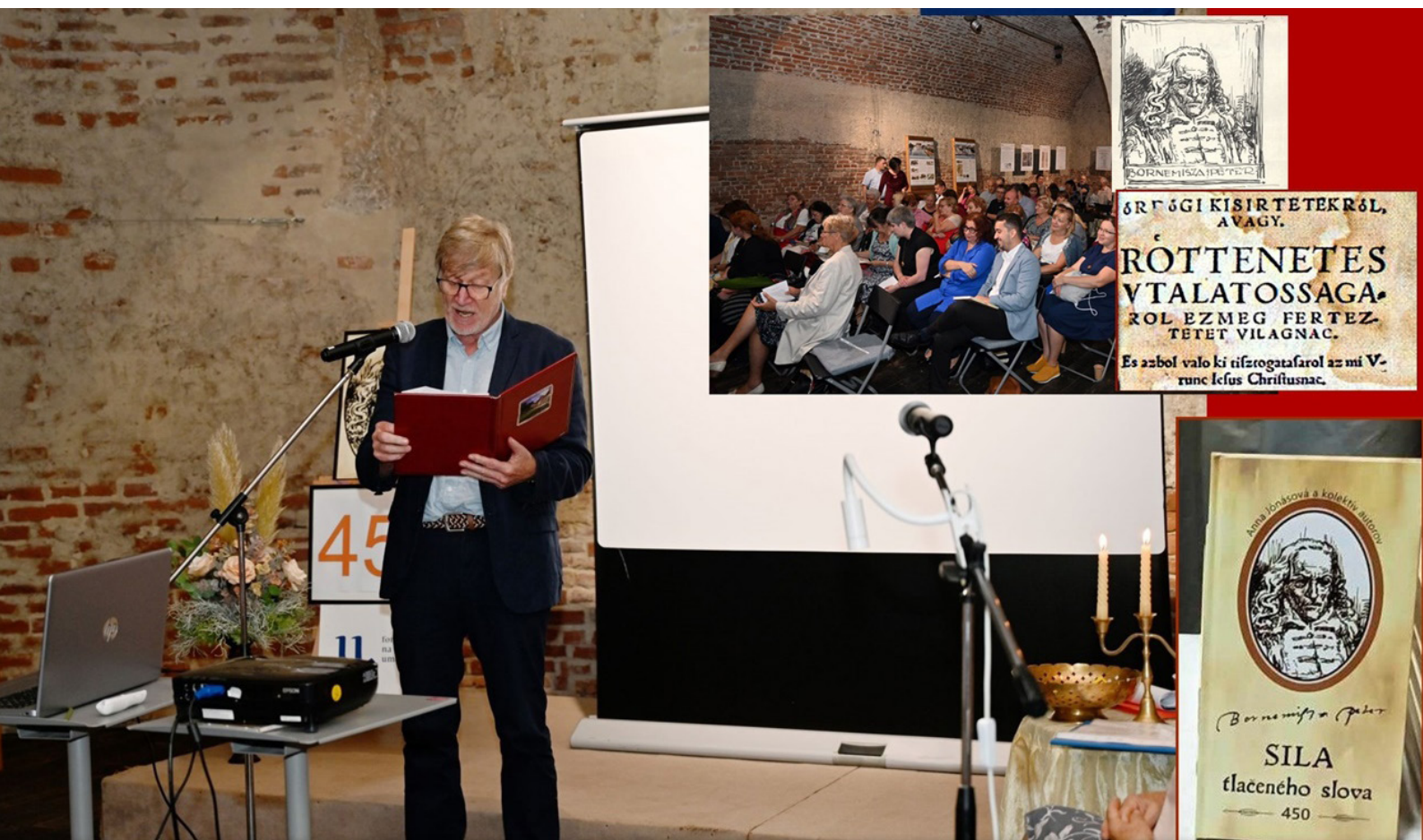
Podujatie 450. výročie príchodu Petra Bornemiszu do Šintavy.

Podujatím 450. výročie príchodu Petra Bornemiszu do Šintavy a zborníkom Sila tlačeného slova sme sa snažili obyvateľom lokalít, v ktorých žil a pracoval, ale aj širšiemu okruhu čitateľov s hlbším záujmom o dejiny knižnej kultúry a kníhtlačiarstva pripomenúť osobnosť vzdelanca, kňaza, kazateľa, autora, nedostižného