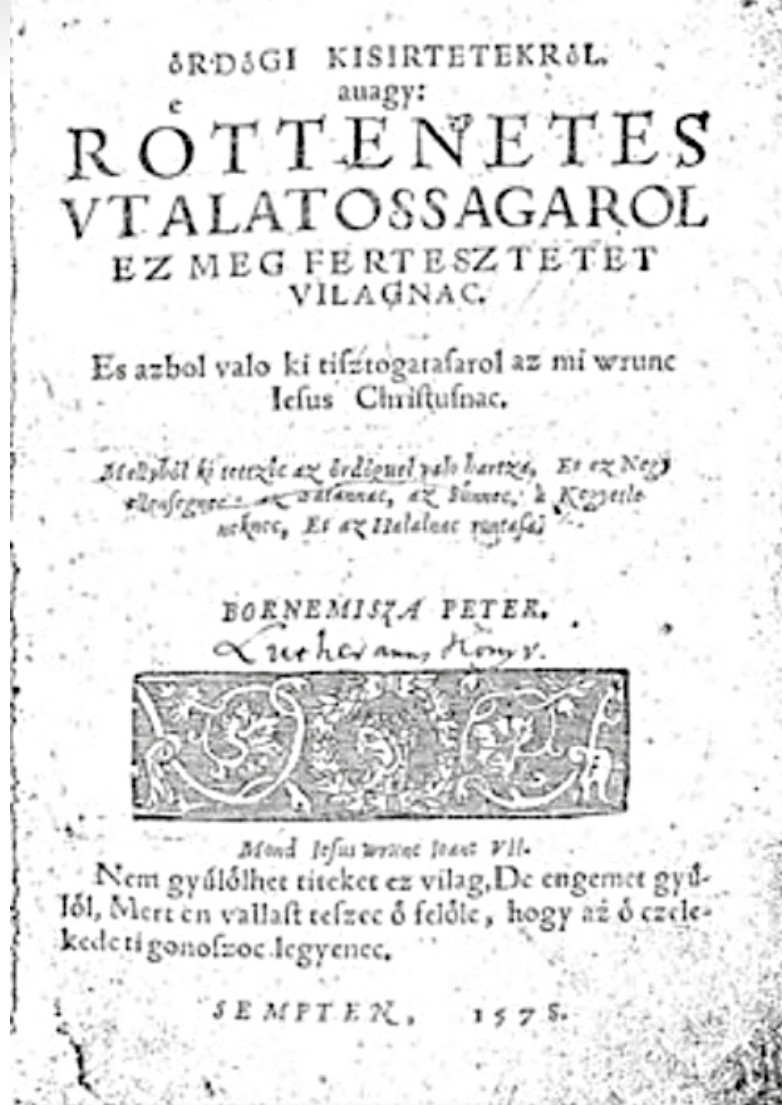
Diabolské rozprávky (1575).