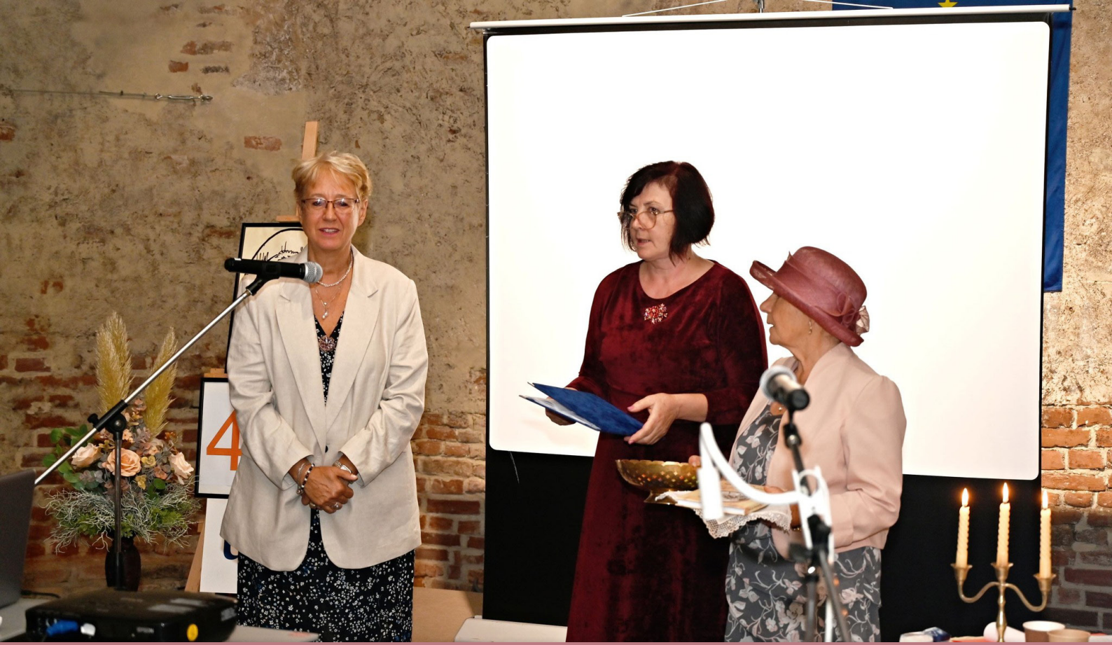
Podujatie 450. výročie príchodu Petra Bornemiszu do Šintavy.

podujatie venované tomuto oddanému humanistovi. Životopisné údaje, ako aj historické, literárnokritické a teologické hodnotenia jeho monumentálneho diela vyšli v Maďarsku vo viacerých odborných, konfesijných a populárnych publikáciách (v stručných aj obsirnejších verziách), avšak súpis literatúry o tomto dejateľovi na Slovensku, respektíve historiografická reflexia jeho diela zo špecifického slovacikálneho hľadiska absentuje, prípadne je minimálna. Pohľad na rozsiahlu databázu maďarských prameňov potvrdzuje, že život a dielo Petra Bornemiszu by neobsiahla ani niekoľkodňová vedecká konferencia.