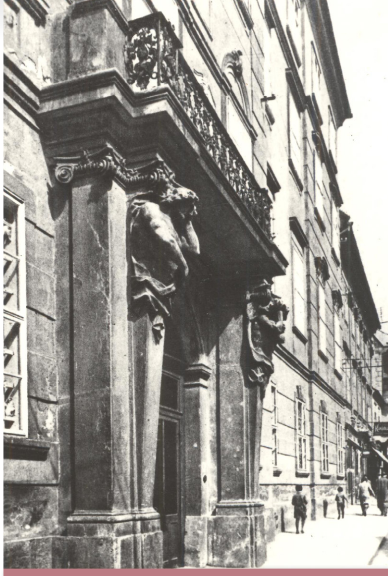
Budova Univerzitnej knižnice v Bratislave.

do roku 1700 (Čaplovič, 1972 – 1984) a Bibliografia písomníctva slovenského (Rizner, 1929 – 1934) – spracovaním slovenskej tlačenej produkcie po roku 1900 v Soupisě československé literatury za léta 1901 – 1925 (Nosovský – Pražák, 1931 – 1938) a spolupracoval aj na Knihopise českých a slovenských tisků od doby nejstarší až do konce 18. století (Tobolka, 1939 – 1967). Popritom sa Slovenské oddelenie spolupodieľalo aj na realizovaní úloh súbežnej bibliografie vydávaním Bibliografického katalógu (1923 – 1936) od roku 1923 do roku 1935.