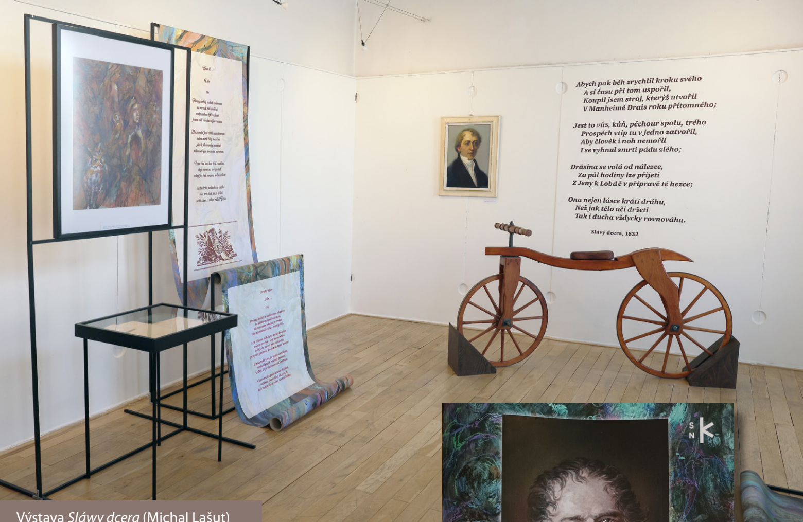
Výstava Slávy dcera