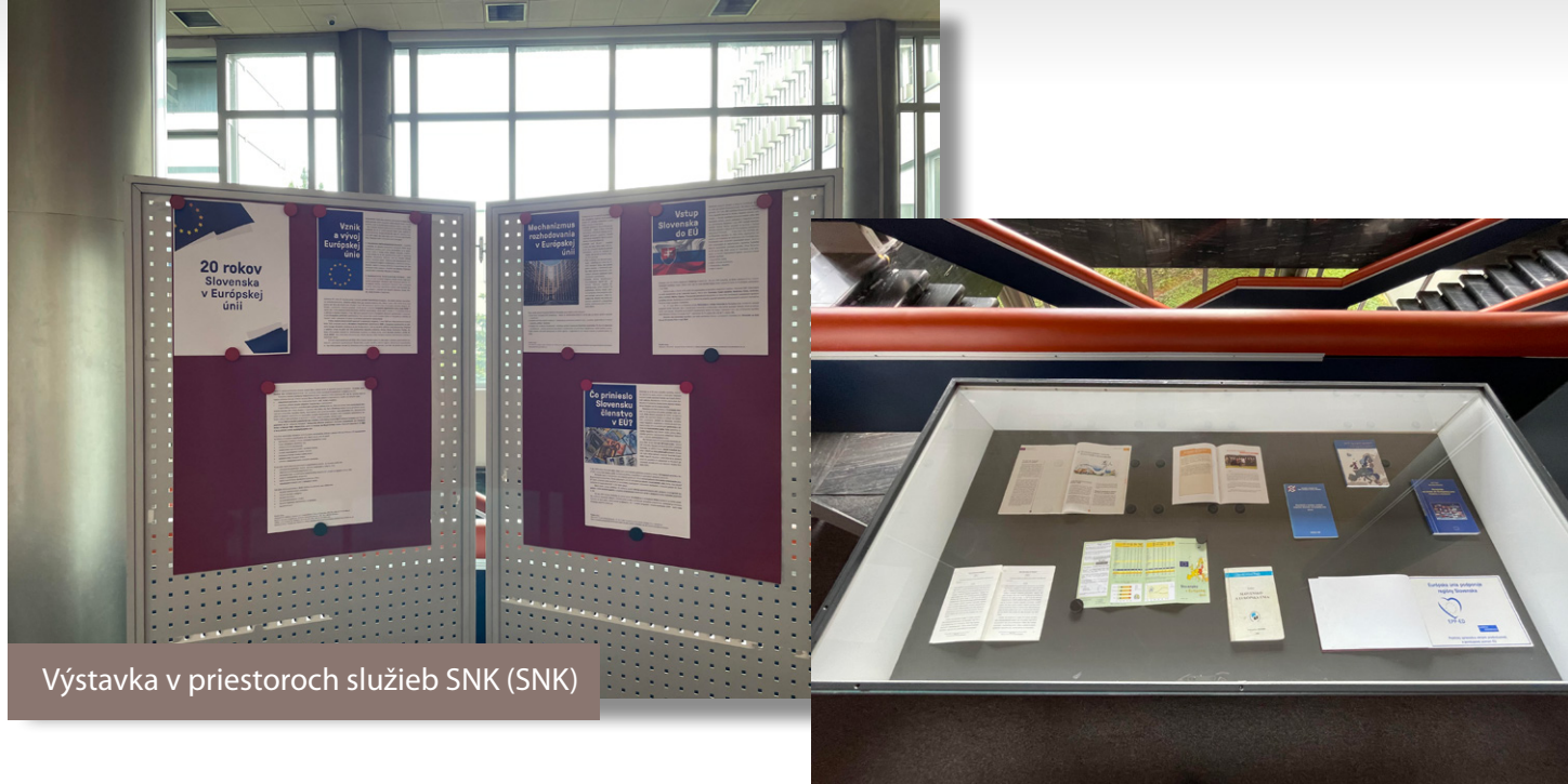
Výstava v priestoroch služieb SNK (SNK)