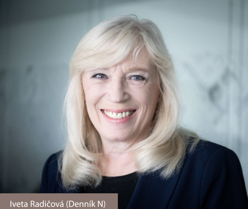
Iveta Radičová