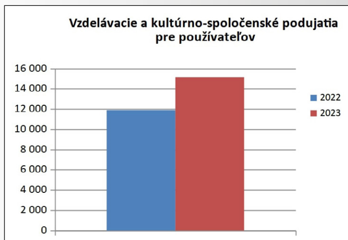
Graf 3 Podujatia pre používateľov v školských knižniciach v rokoch 2022 a 2023

NIVaM pri príležitosti októbra ako Medzinárodného mesiaca školských knižníc 2023 zorganizoval pre stredné školy 12. ročník celoslovenského projektu Záložka do knihy spája slovenské školy: Hrdinovia detektívnych románov . Jeho cieľom bolo nadviazanie kontaktov medzi slovenskými strednými školami a podpora čítania prostredníctvom výmeny záložiek do kníh, ktoré žiaci vyrobili ľubovoľnou technikou na vyhlásenú tému. Do celoslovenského projektu sa prihlásilo 172 stredných škôl s celkovým počtom 9 036 žiakov .