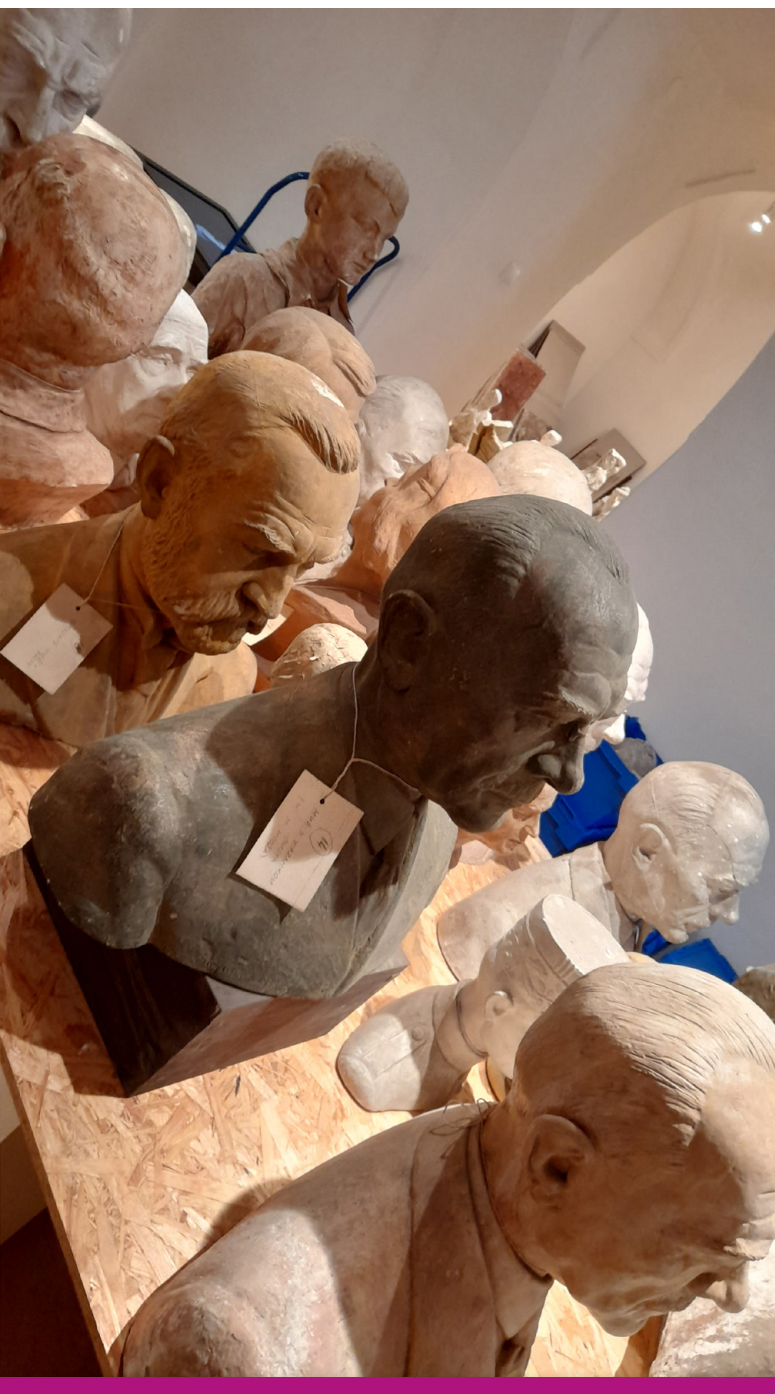
Výstava Otvorený archív.