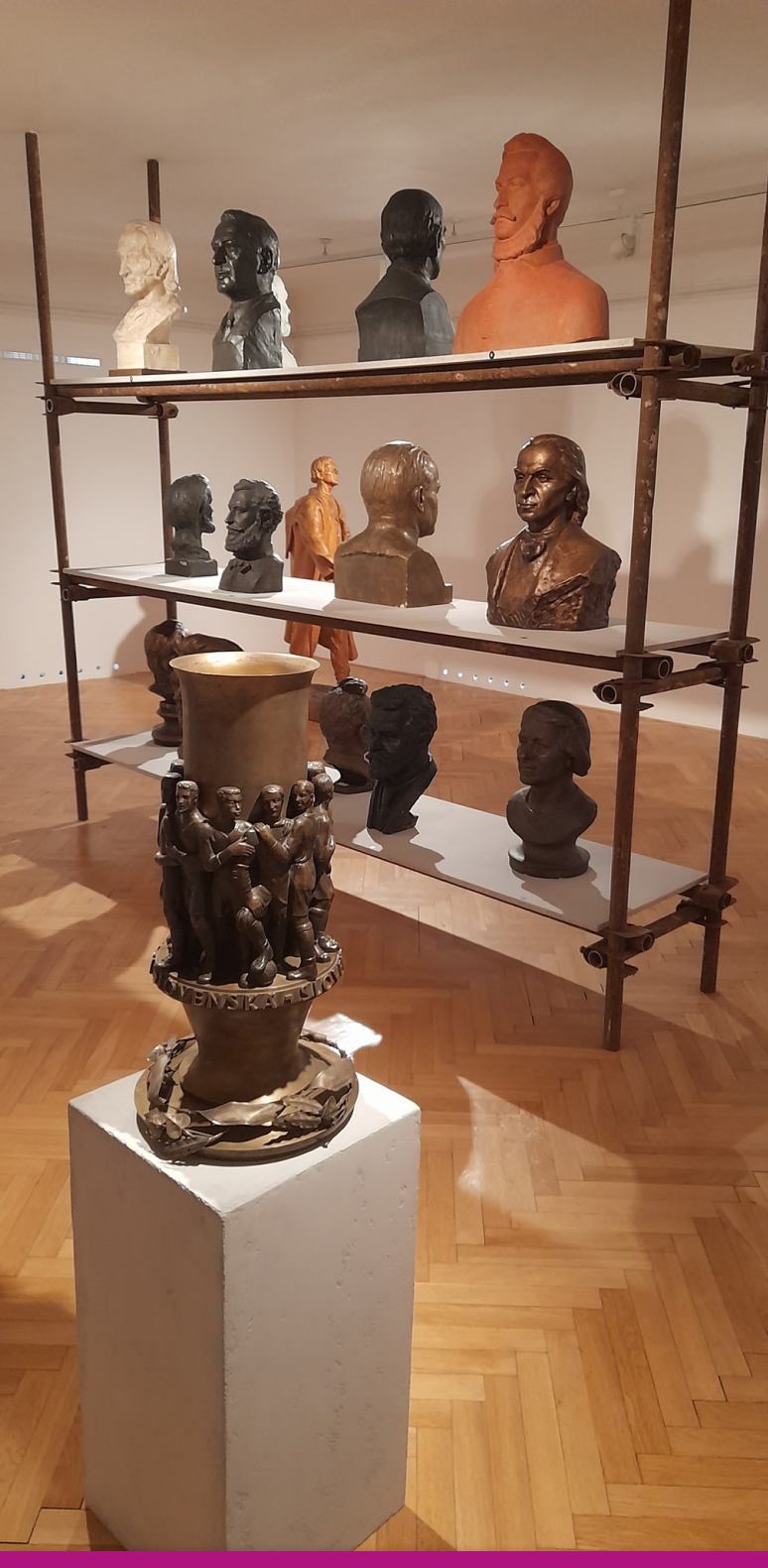
Výstava Tretí rozmer premenlivej doby.