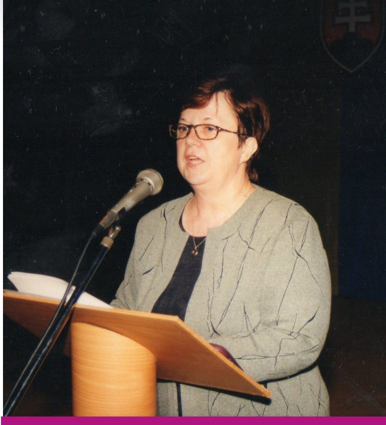
Seminár Informačné správanie , KKIV 2008.