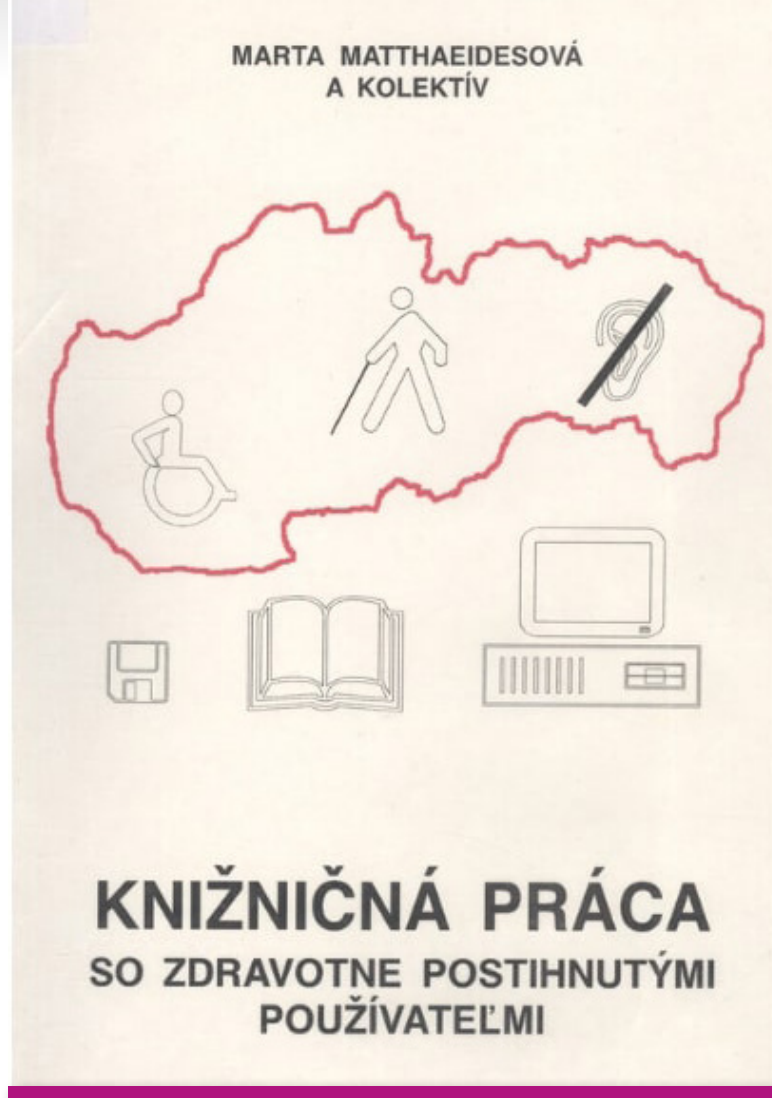
Obálka publikácie Knižničná práca so zdravotne postihnutými používateľmi .