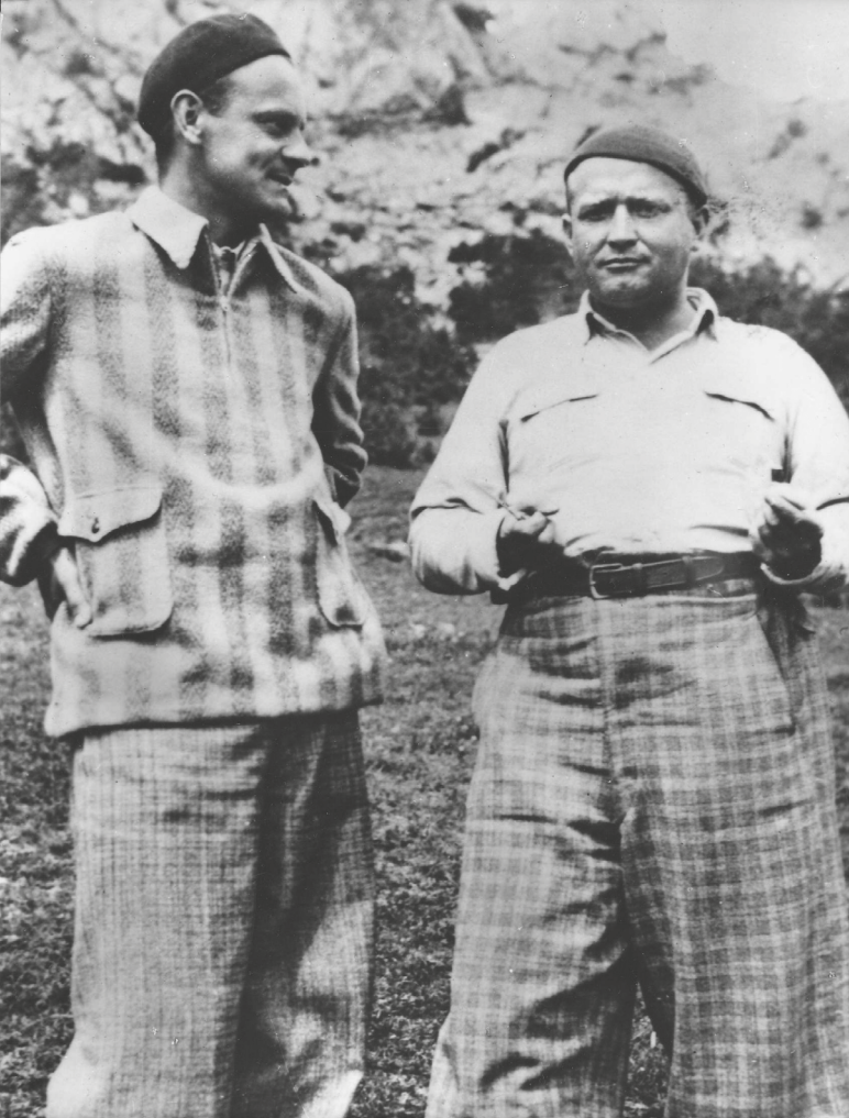
Janko Alexy s Milošom Alexandrom Bazovským.

výtvarného východiska. Miloš Bazovský aj mňa si povšimol. Prebásnil svojím koloritom Hôrnych chlapcov a obraz uverejnil v Živene. Ale nepotreboval ani mňa, ani Benku za svoj stály vzor. Vtedy, keď som ja vystavil v Umeleckej besede slovenskej v Bratislave olejomalbu „Pijú chlapci, pijú“, on sa objavil s malým obrázkom „Detvani“. Traja chlapi, Detvani, sedia v krčme pri stole. Taký rázovitý,