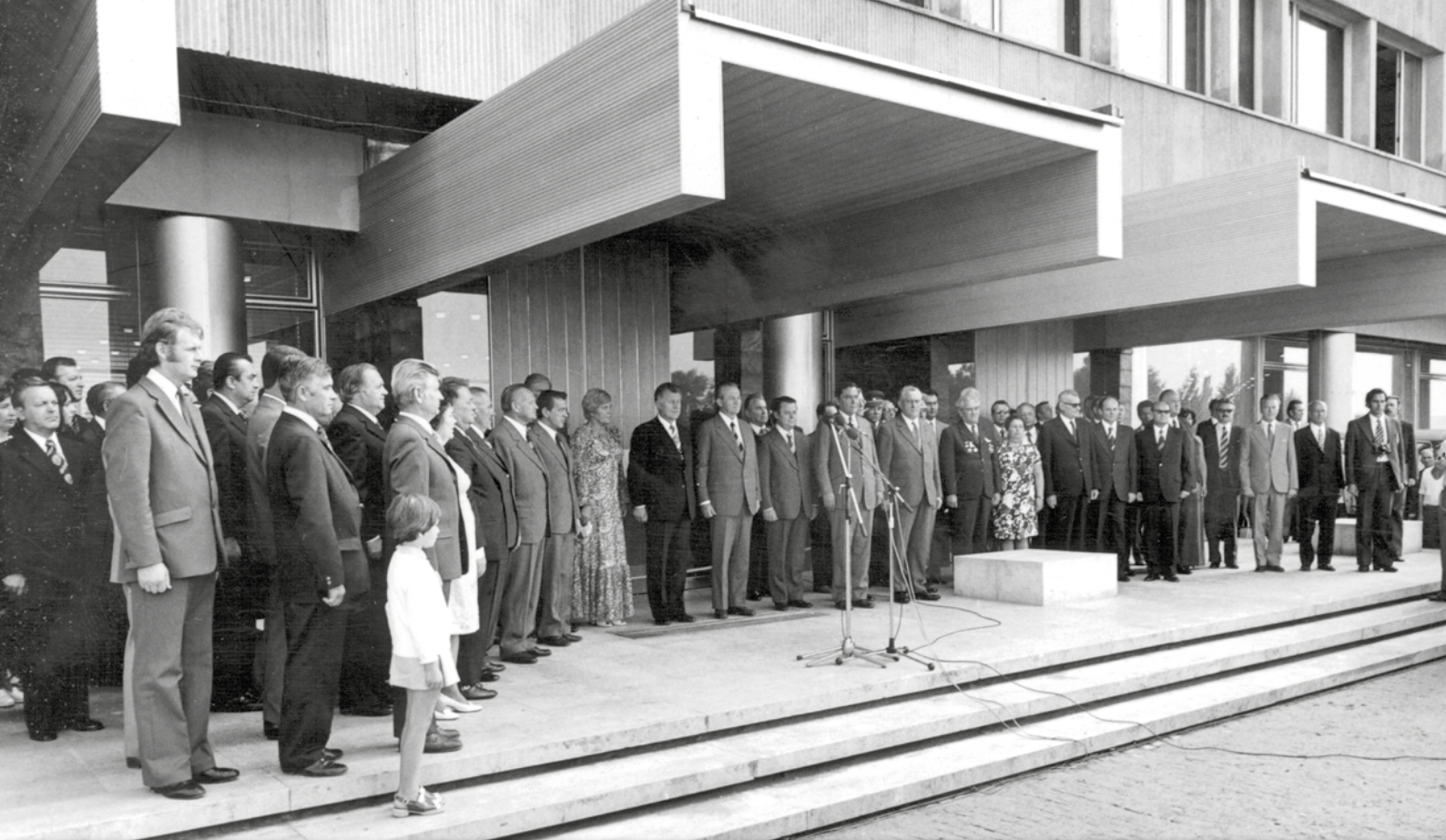
Otvorenie tretej budovy Matice slovenskej na Hostihore (31. 8. 1975).