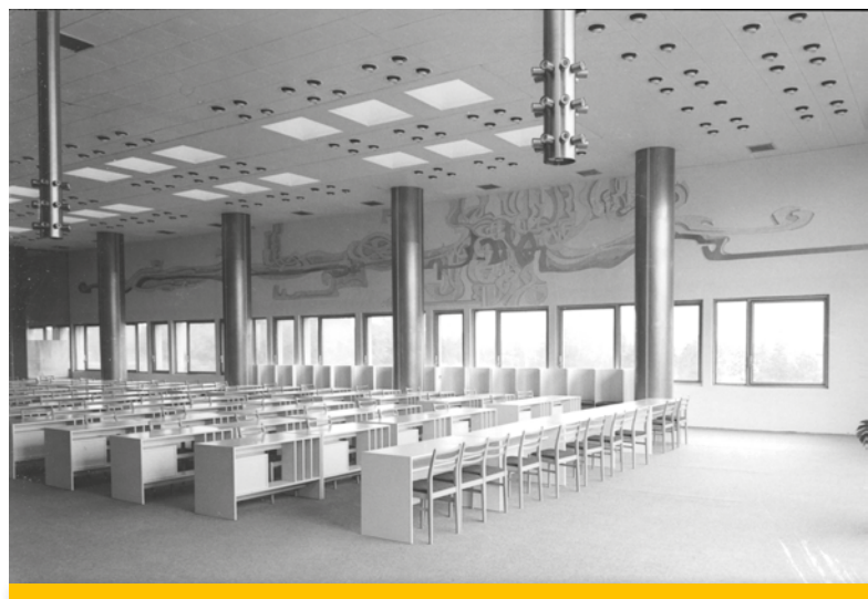
Spoločenská sieň Zlatá niť (pomenovaná podľa pozlátenej nástennej výzdoby nad okennou časťou od akademickej maliarky Eleny Bellušovej).

Emotívnu zložku posilňujú jedinečné umelecké diela, ktoré svojou nadčasovosťou a dekoratívnou funkciou