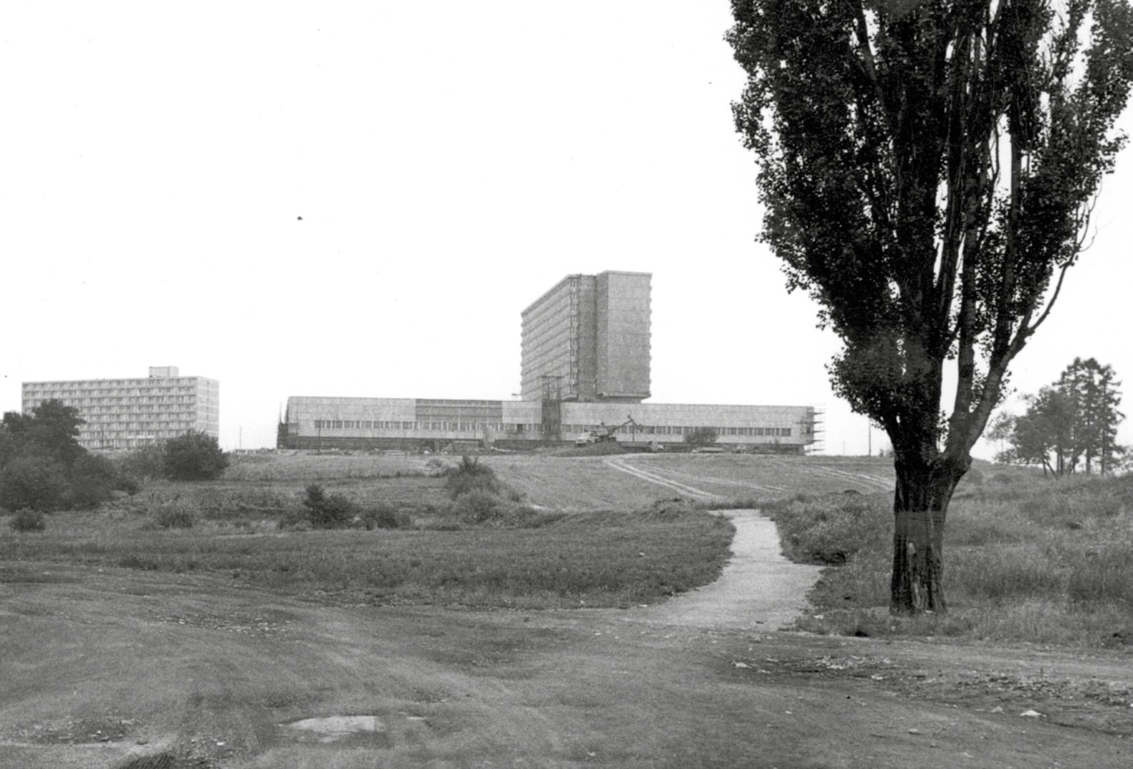
Budova Matice slovenskej na Hostihore v Martine pred jej dokončením.

Budova Slovenskej národnej knižnice patrí k dominantám mesta Martin a ikonám modernej slovenskej architektúry v druhej polovici 20. storočia. Jej základný kameň položili pred 60. rokmi. Pre časopis Knižnica sme pri tejto príležitosti pripravili príspevok a výberovú bibliografiu.