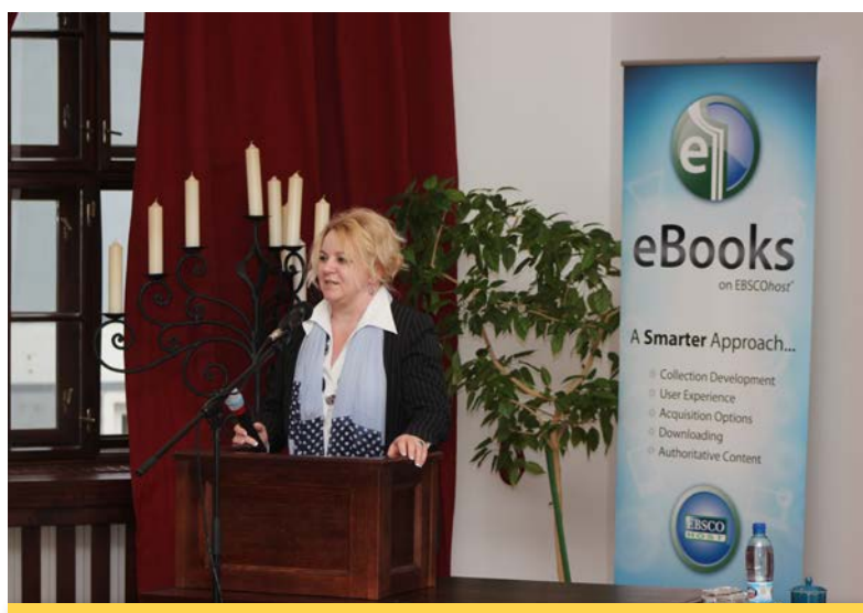
Seminár Tlib (2014)