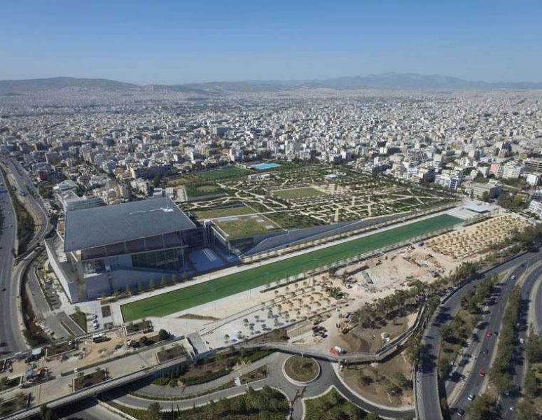
Obr. 2 Stavros Niarchos Foundation Cultural Center (SNFCC).