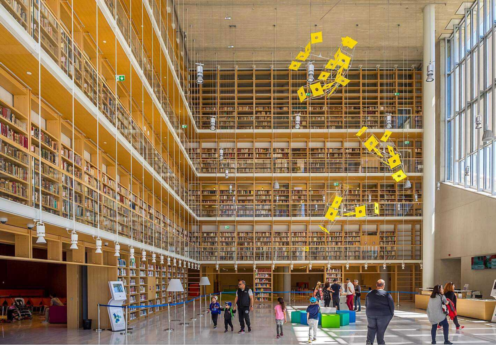
Obr. 3 Stavros Niarchos Foundation Cultural Center – National Library of Greece.

konkrétnych činností, na ktoré je priestor určený. Nájde tu sekciu Media Lab, nahrávaciu miestnosť a priestory špeciálne navrhnuté pre deti, ale aj pre dospelých rôznych vekových skupín. Tieto oblasti zahŕňajú podnikateľské centrum, oblasť, ktorá pôsobí ako inkubátor nápadov a podnikateľských iniciatív, a to prostredníctvom dostupnosti priestorov, ako aj služieb, ktoré poskytuje. 7