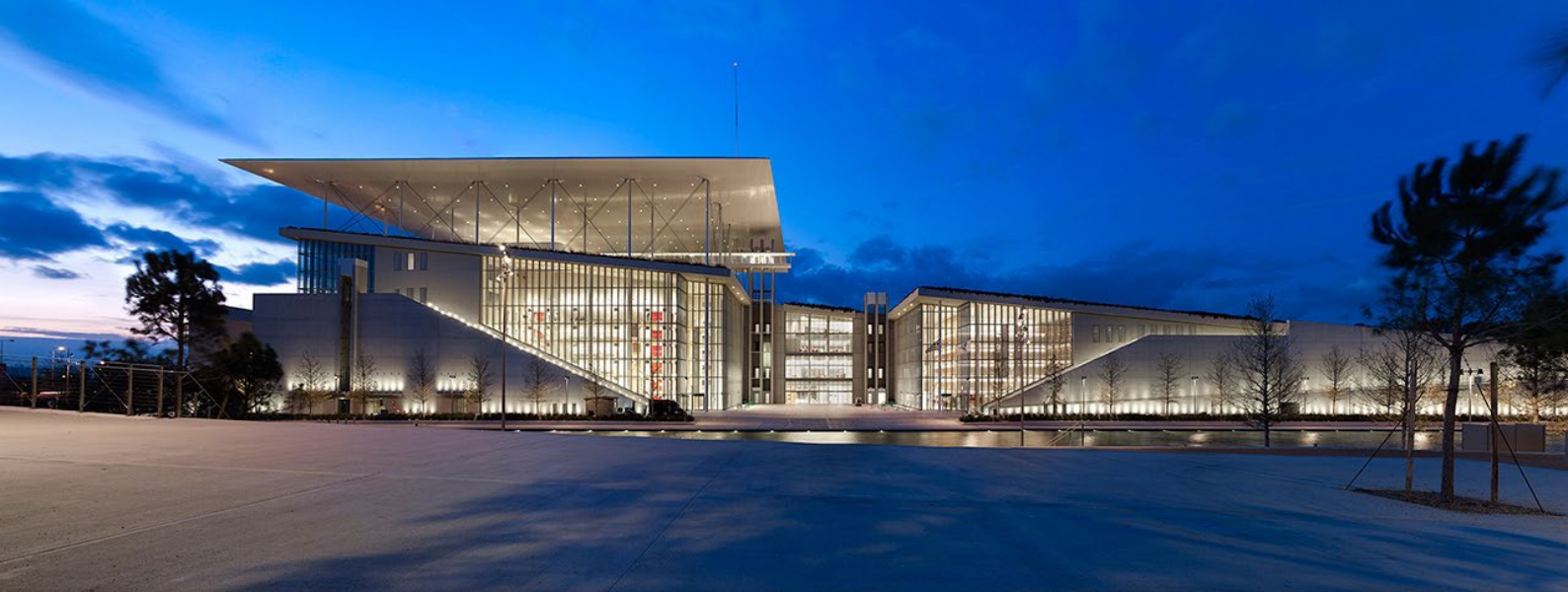
Obr. 1 Stavros Niarchos Foundation Cultural Center (SNFCC). Zdroj: internet

Historický prerod NLG na SNFCC bol umožnený vďaka exkluzívnemu grantu vo výške 5 miliónov eur od Nadácie Stavrosa Niarchosa, ktorý pokryl rozvoj zbierky NLG, vytvorenie digitálnych služieb knižnice, jej rozvoj a kampaň na rozvoj publika, školenia zamestnancov a ďalšie. 1