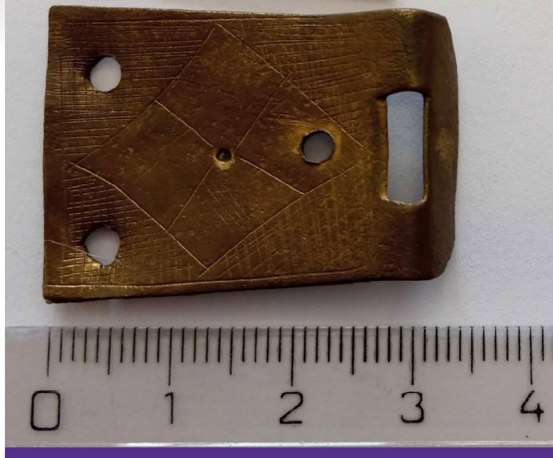
Obr. 2 Štítok spony (pr. č. 11/87).

Z umenovedného hľadiska menej významné, ale z pohľadu dotvárania obrazu o kníhviazačskej produkcii sú dôležité štítky spôn s jednoduchým a nevýrazným zdobením. Nájdenej ich bolo desať a väčšinou sú obdĺžnikového tvaru. Sú nenáročné, zdobené vykrojením v smere do stredu dosky v tvare oslieho chrbta (označuje sa aj v tvare písmena „T“) 52 , zubcovo 53 alebo v tvare vlnovky 54 . Plocha je zdobená väčšinou veľmi jednoduchými linkami. Dva štítky – jeden uložený v SNK a druhý v ELTE, majú pomerne jednoduchú výzdobu plochy razením jednovencovej šesťlistovej rozety. 55 Pomerne primitívne vyrytú linku pozorujeme pri zdobení štítka spony. Tá sa používala pri zdobení napríklad v tvare kosoštvorca s krížom vo vnútri alebo v obdĺžnikovom tvare (Obr. 2). 56 Toto nenáročné prevedenie výzdoby nám absentuje pri iných podobne spracovaných sponách aj v ďalších lokalitách. Z tohto dôvodu môžeme predpokladať realizáciu kovového prvku v domácich reáliách. Možnosť zdobenia samotnými kartuziánmi nám potvrdzuje aj nález archeológov na Kláštorsku z roku 1991. 57 Odhalené bolo malé bronzové razidlo (Obr. 3), ktoré razením vytvára