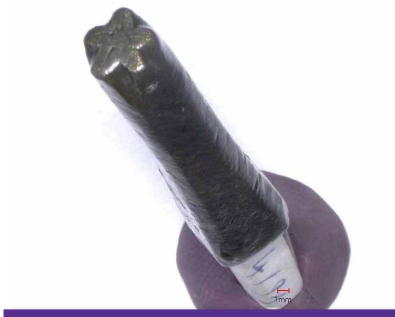
Obr. 3 Bronzové razidlo (pr. č. 4/91).

podobne veľkú jednovencovú rozetu, ale s piatimi listami. Mohlo byť použité práve pri výzdobe kovových prvkov knihy alebo pri dotváraní knižného pokryvu. Predmetné nenáročné zdobené štítky naznačujú a čiastočne potvrdzujú kníhviazačskú produkciu kartuziánov na Kláštorsku. Libri catenati sa nazývali knihy upevnené reťazou k čitateľskému pultu, čím sa chránili pred odcudzením alebo v prípade kláštora nedovoleným odnášaním z priestoru knižnice. 58 Takáto spona s málo čitateľným nevýrazným nápisom maria a reťazou s tromi dielcami bola objavená na Kláštorsku. 59 Dôležitosť tohto objavu podčiarkuje aj nezachovanie takto chránenej tlače proveniencie spišských kartuziánov v slovenských alebo zahraničných knižniciach.