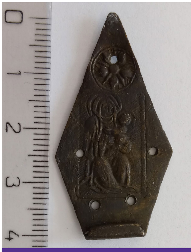
Obr. 1 Madona s dieťaťom (pr. č. 11/89). 49

Najrozšírenejším zdobením základne spony je nápisový motív, ktorý obsahuje rôzne variácie a skratky mena Mária. 45 V dvoch prípadoch ide o skratku ihs . 46 Meno Mária sa odvodzuje od egyptského Marje, čo znamená milovaná alebo od hebrejského Mirjam. Do konca 18. storočia sa hebrejský tvar mena prekladal ako stella maris (hviezda morská), čo sa odzrkadilo aj v literárnej sakrálnej tvorbe, napríklad v hymne Ave maris stella alebo v loretánskych litániach. 47 Skratka písmen „ihs“ sa interpretuje ako skratka mena Iesus alebo neskôr z latinského: In hoc signo – v tomto znamení zvíťazíš. Ďalším možným vysvetlením je využitie začiatkových písmen: Jesus hominum Salvator – Ježiš spasiteľ ľudstva. Skratka sa v novoveku spája najmä s jezuitmi a ich zakladateľom sv. Ignáčom z Loyoly. 48