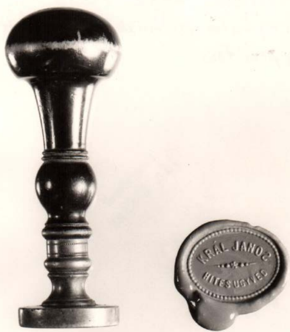
Obr. 8 Pečatidlo Janka Kráľa.