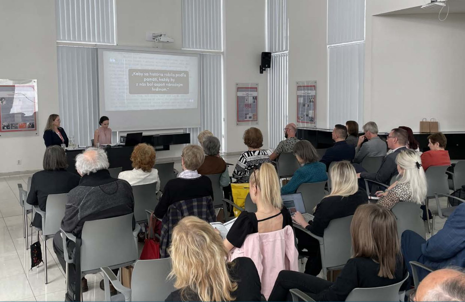
Konferencia.