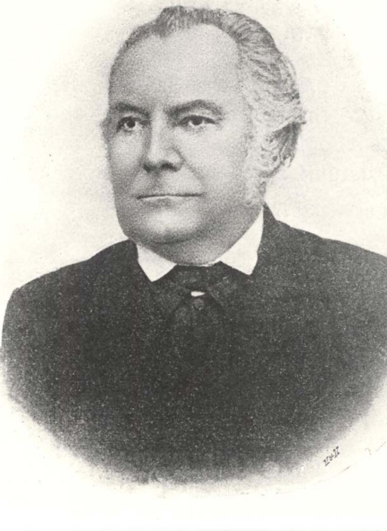
Podobizeň Jozefa Ľudovíta Holubyho.

Školská dochádzka detí ľudových (základných) škôl v 2. polovici 19. storočia i začiatkom 20. storočia bola ovplyvnená rôznymi faktormi. Predovšetkým išlo o potreby domácností, v ktorých museli školské deti často pomáhať alebo dokonca zastupovať rodičov pri hospodárskych prácach od jari až do jesene a v zimnom období v mnohých oblastiach Slovenska zase nepriaznivé poveternostné podmienky znemožňovali žiakom dostať sa do školy, najmä v takých prípadoch, keď žili v odľahlejších oblastiach.