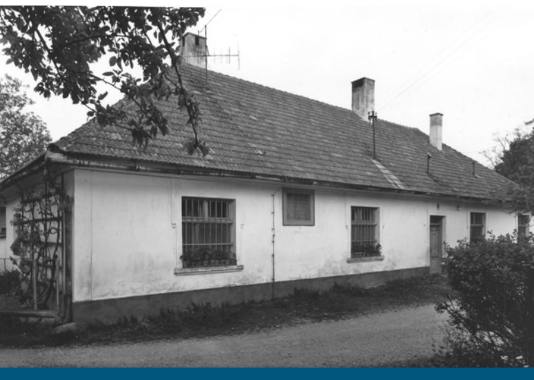
Ev. a. v. fara v Zemianskom Podhradí, miesto pôsobenia Jozefa Ľudovíta Holubyho v rokoch 1861 – 1909.

V dokumente sa ďalej uvádza, že „v tomto kraji (Zemianske Podhradie a okolité obce s kopanicami – pozn. aut.) býva školopovinných 6 – 12 ročných detí 12 % veškerého obyvateľstva, zriedka viac. V Podhradí malo vtedy 479 ev. obyvateľov 57 žiakov, Bošáca zo 642 ev. duší 72 žiakov, spolu 129 žiakov. Dakolko žiakov bolo aj z blízkyh kopanic a z Haluzíc“.