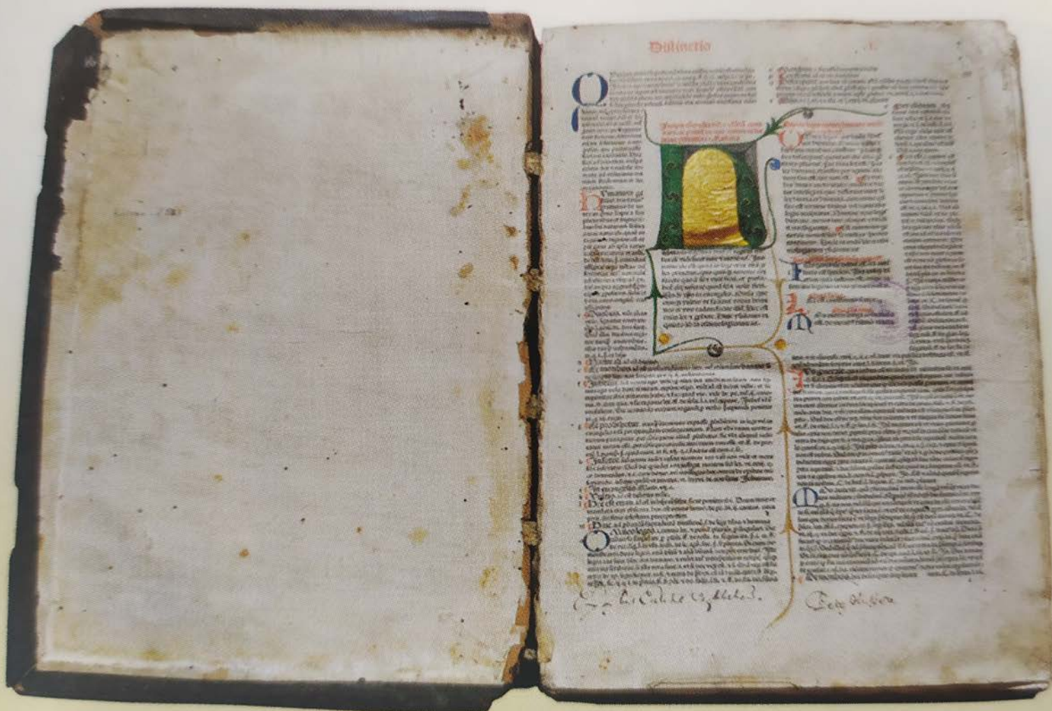
Prvá strana prvotlače Gratianus – Decretum cum commentario Bartholomei Brixiensis, 1481