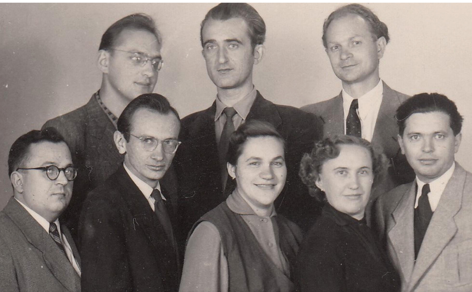
Kolektív bibliografov.