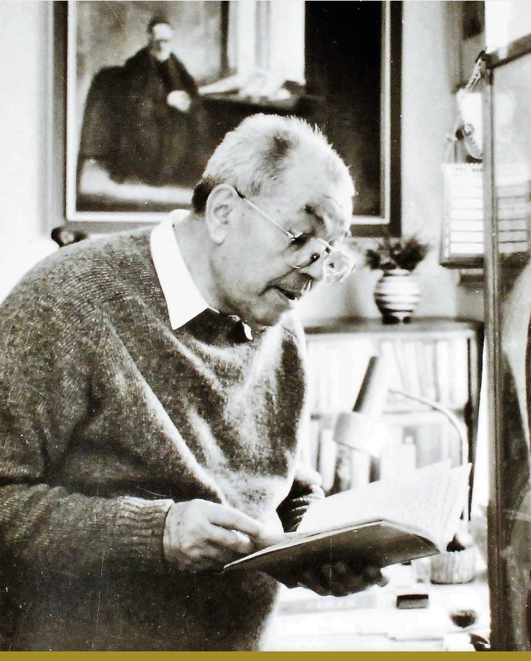
Potemra v dôchodkovom veku.