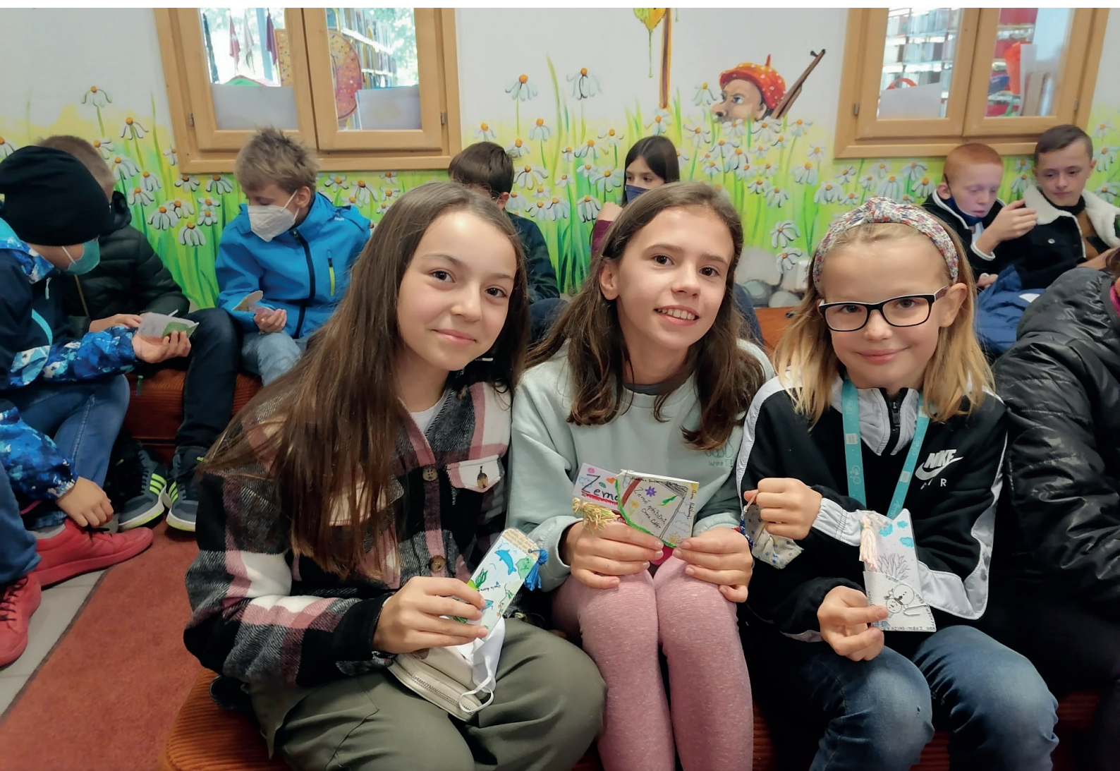
Česko-slovenský projekt Záložka do knihy spája školy – Gymnázium J. M. Hurbanu v Čadci

Pri príležitosti októbra ako Medzinárodného mesiaca školských knižníc 2021 zorganizoval Odbor Slovenskej pedagogickej knižnice v spolupráci s Knižnicou Jiřího Mahena v Brne 12. ročník česko-slovenského projektu Záložka do knihy spája školy . Jeho cieľom bola podpora čítania prostredníctvom výmeny záložiek do kníh, na ktorých žiaci ľubovoľnou technikou stvárňali tému česko-slovenského projektu Očarujúci svet knižných príbehov, rozprávok a básní , a takisto nadviazanie priateľských kontaktov medzi českými a slovenskými základnými školami a osemročnými gymnáziami. Zúčastnené české a slovenské školy využili výmenu záložiek aj na podrobnejšie poznávanie jazyka, literatúry, histórie, kultúry či regionálnych zvykov v spriatelenej republike. Veľa škôl v Českej