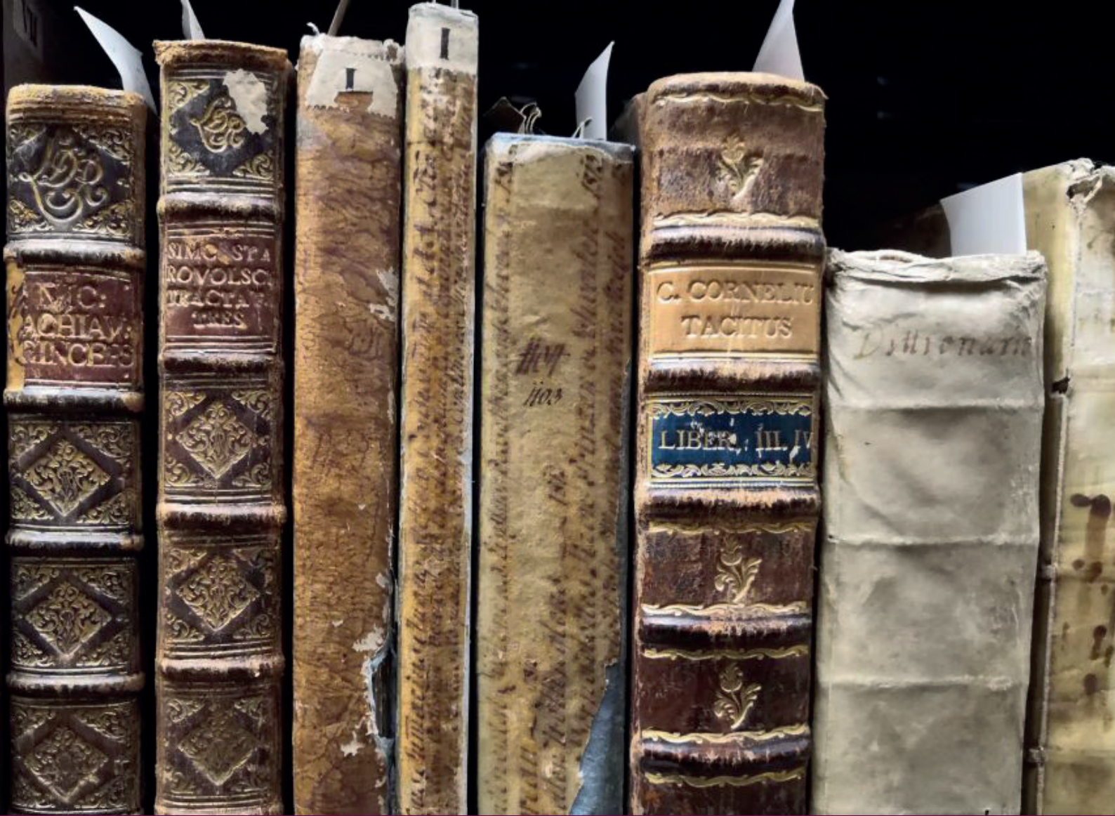
Historické knižničné dokumenty.

V júni 2021 bola časť fondu starých a vzácných dokumentov Štátnej vedeckej knižnice v Banskej Bystrici vyhlásená Ministerstvom kultúry Slovenskej republiky za Historické knižničné dokumenty (HKD). Týmto krokom sa knižnica snažila zabezpečiť, aby tlače s jedinečnou hodnotou dostali legislatívnu formou lepšie možnosti ochrany. Vyhlásených bolo 392 knižničných jednotiek. Ide o najstaršie a najvzácnejšie dokumenty vydané v priebehu 16. až 19. storočia s doložitelným regionálnym prepojením najmä na produkciu banskobystrických tlačiarov a vlastníkov. Z chronologického hľadiska je najvzácnejších päť tlačí zo 16. storočia. Z ostatných zastúpených období prevládajú predovšetkým tlače vydané v priebehu 18. a 19. storočia. Dôležitým kritériom pri výbere titulov bolo aj provenienčné hľadisko. Do výberu sú zaradené hlavne pozoruhodné knihy pochádzajúce z regionálnych inštitucionálnych i súkromných knižníc.