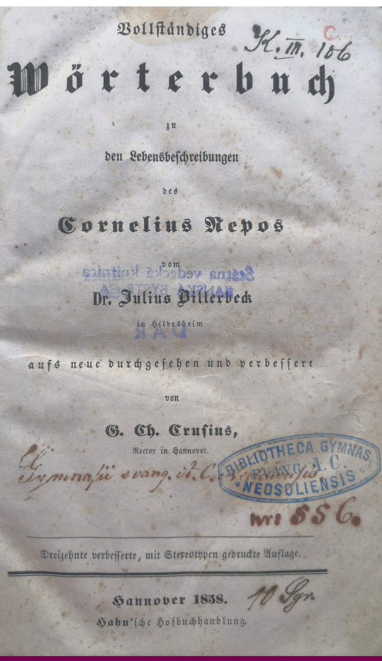
Slovník z knižnice Evanjelického gymnázia v Banskej Bystrici.

Do výberu je tento rozsiahlejší počet historických dokumentov/tlačí/ zaradený aj z toho dôvodu, že už v minulosti bola iná časť tejto knižnice zaevidovaná v Ústrednej evidencii HKD a HKF (Knižnica Evanjelického gymnázia v Banskej Bystrici, MK 6599/2004-400).