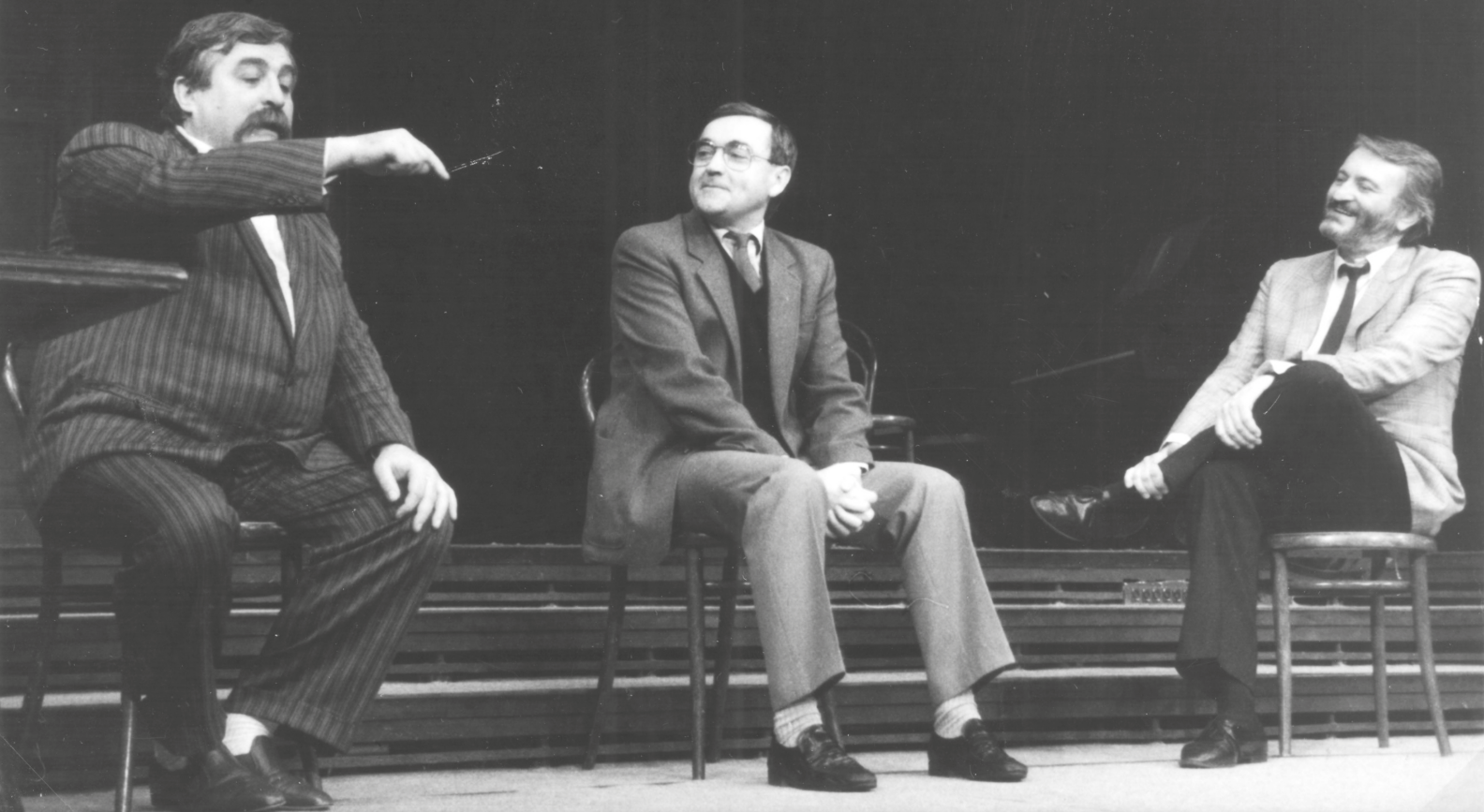
Zľava Júliu Satinský, Stanislav Štepka a Milan Lasica v improvizovanom programe na javisku Štúdia L+S v Bratislave.