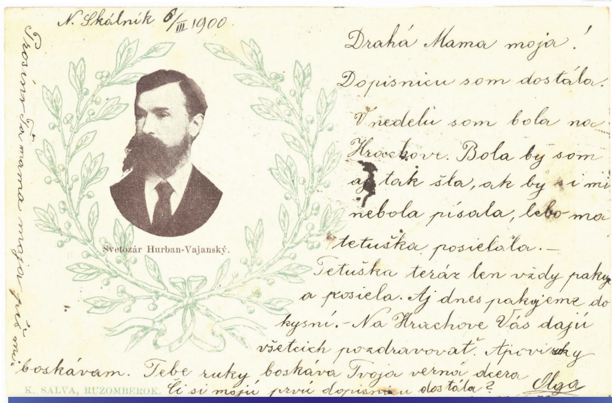
Príležitostná pohľadnica s portrétom Svetozára Hurbana Vajanského (Olga Vraná Terézii Vansovej, r. 1900, LA SNK, sign. 41 HH 43)