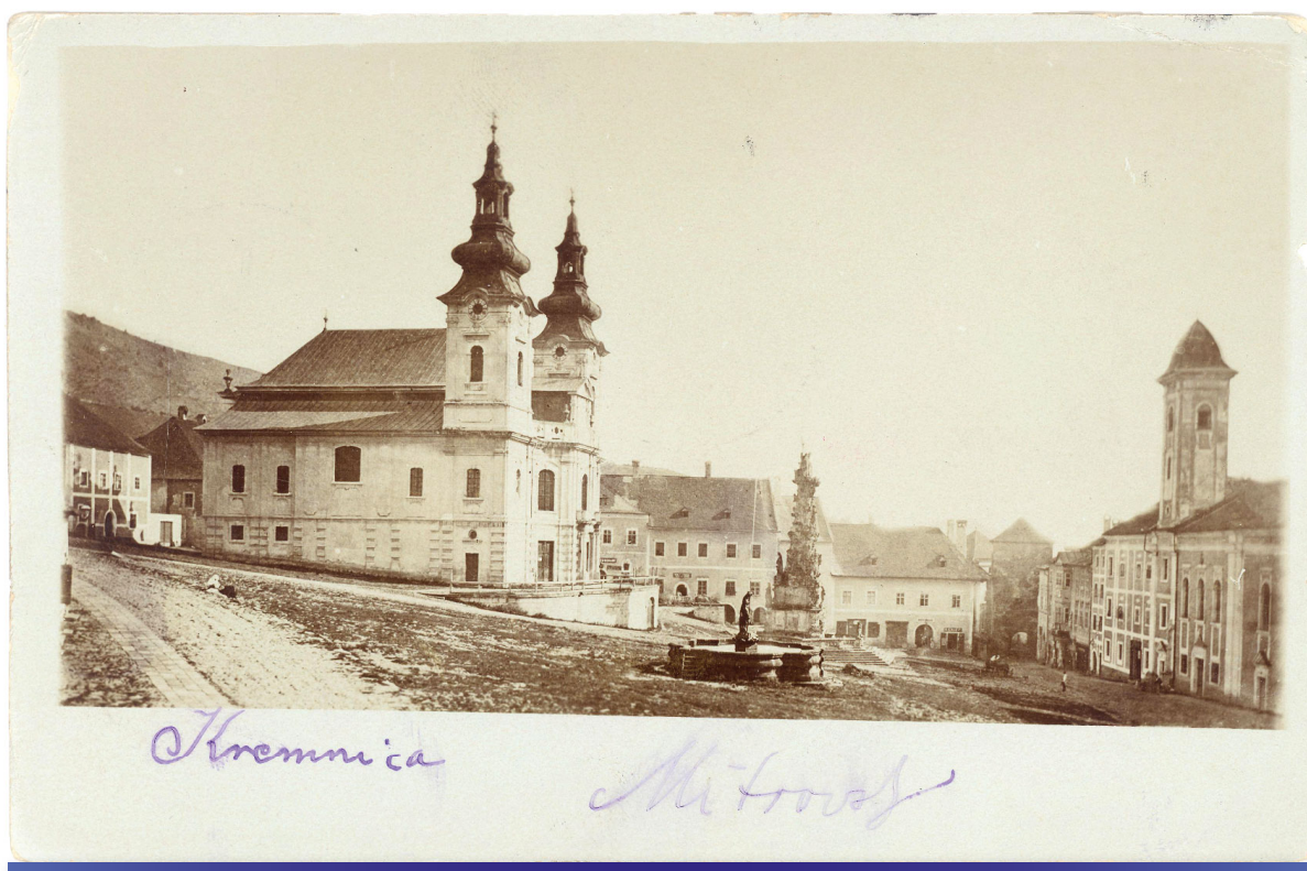
Kremnica (Milan Thomka Mitrovský Anne Halašovej, r. 1900, LA SNK, sign. 37 NN 46)