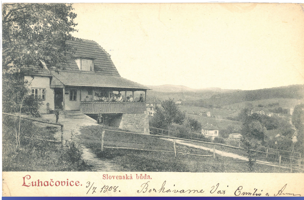
Luhačovice – Slovenská buda (Anna Jurkovičová Ide Hurbanovej, r. 1908, LA SNK, sign. 138 U 30)