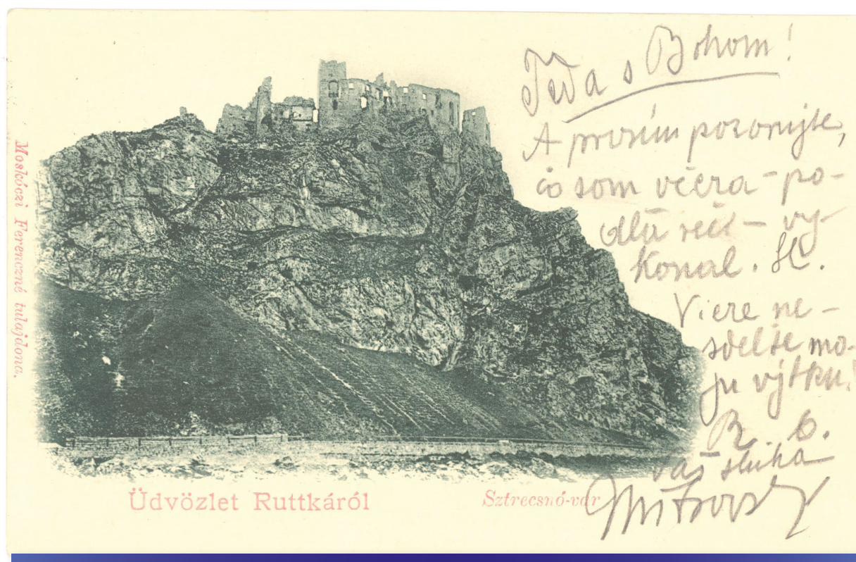
Pohľad na hrad Strečno (Milan Thomka Mitrovský Anne Halašovej, r. 1909, LA SNK, sign. 37 NN 46)