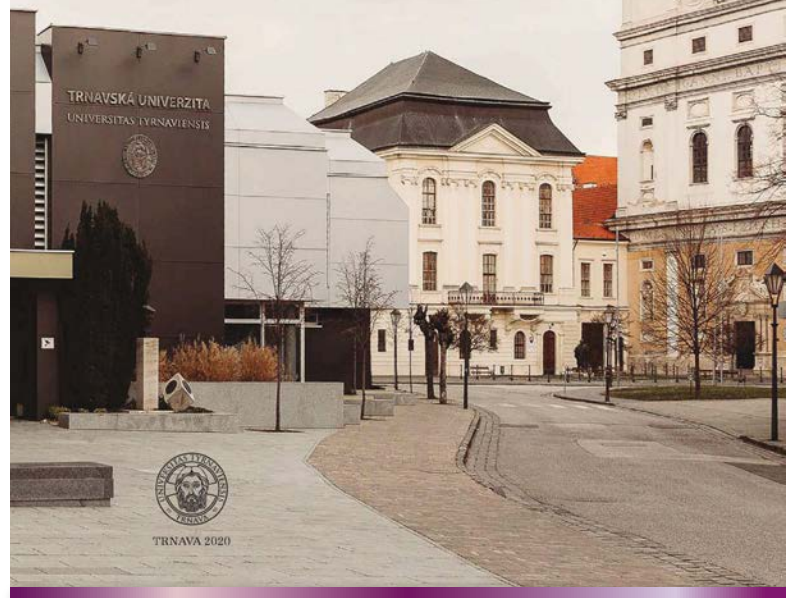
Obálka publikácie Sapientia aedificavit sibi Domum. Budovy Trnavskej univerzity v Trnave