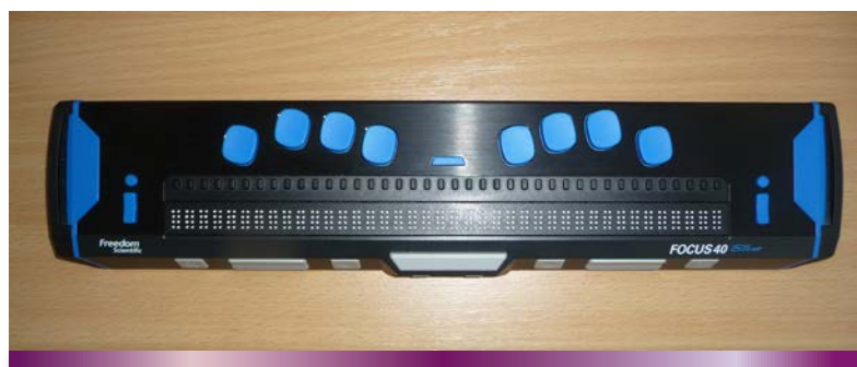
Braillovský hmatový displej zobrazujúci aktuálny riadok z obrazovky, ktorý pri pohybe po obrazovke okamžite mení svoj obsah a zobrazí ho v bodovom písme