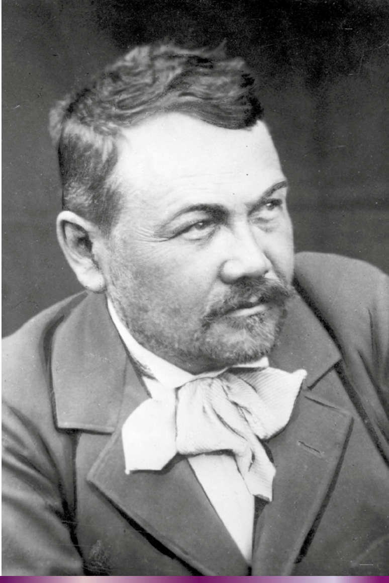
Pavol Országh Hviezdoslav