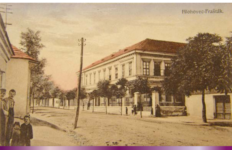
Budova Meštianskej školy v Hlohovci z roku 1882 na pohľadnici z prelomu 20. a 30. rokov 20. storočia