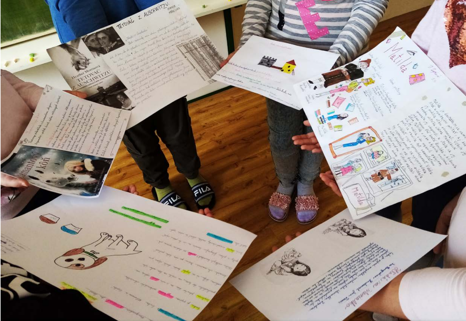
11. ročník česko-slovenského projektu Záložka do knihy spája školy: Radosť z čítania ukrytá vo veršoch básní alebo v próze (Základná škola s materskou školou v Lazanoch)

pričom nezbedného Čina sa snažili pomocou perokresby znázorniť na záložkách. Tretiaci si po prečítaní viacerých kníh od Daniela Heviera vybrali niektoré vtipné príbehy na záložky, aby ich kamaráti z Moravského Krumlova spoznali krásnu slovenčinu. Štvrtáci najprv pred spolužiakmi odprezentovali knihu, ktorá ich v poslednom čase oslovila, potom sa ju snažili vyobraziť na záložke.