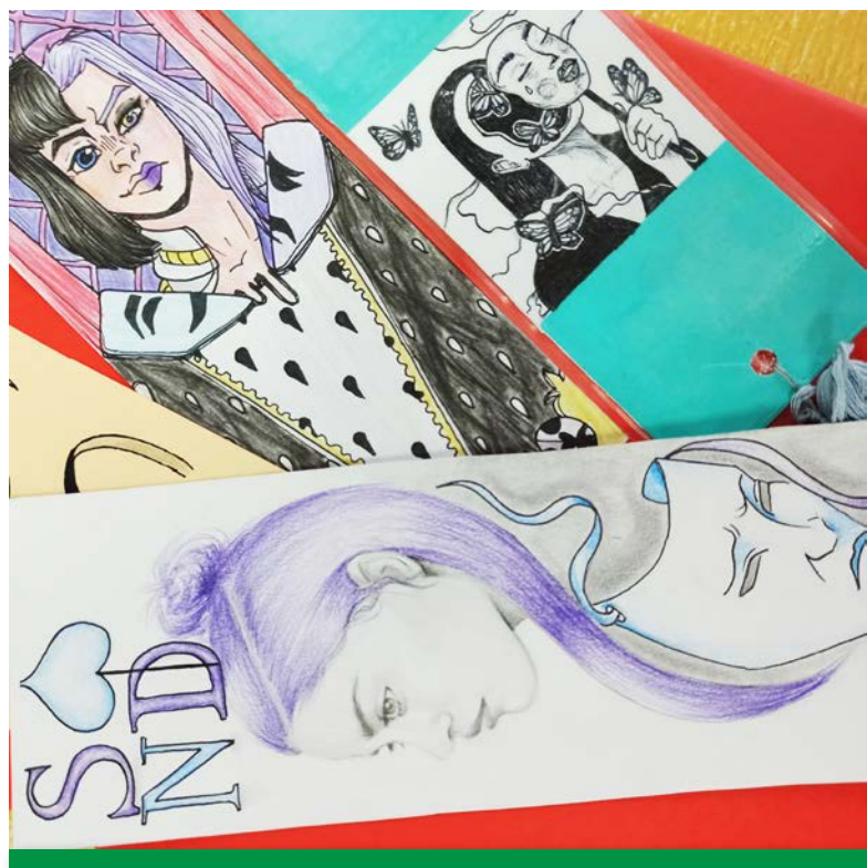
9. ročník celoslovenského projektu Záložka do knihy spája slovenské školy: Osobnosti a diela slovenskej dramatickej tvorby (Gymnázium J. M. Hurbana v Čadci)