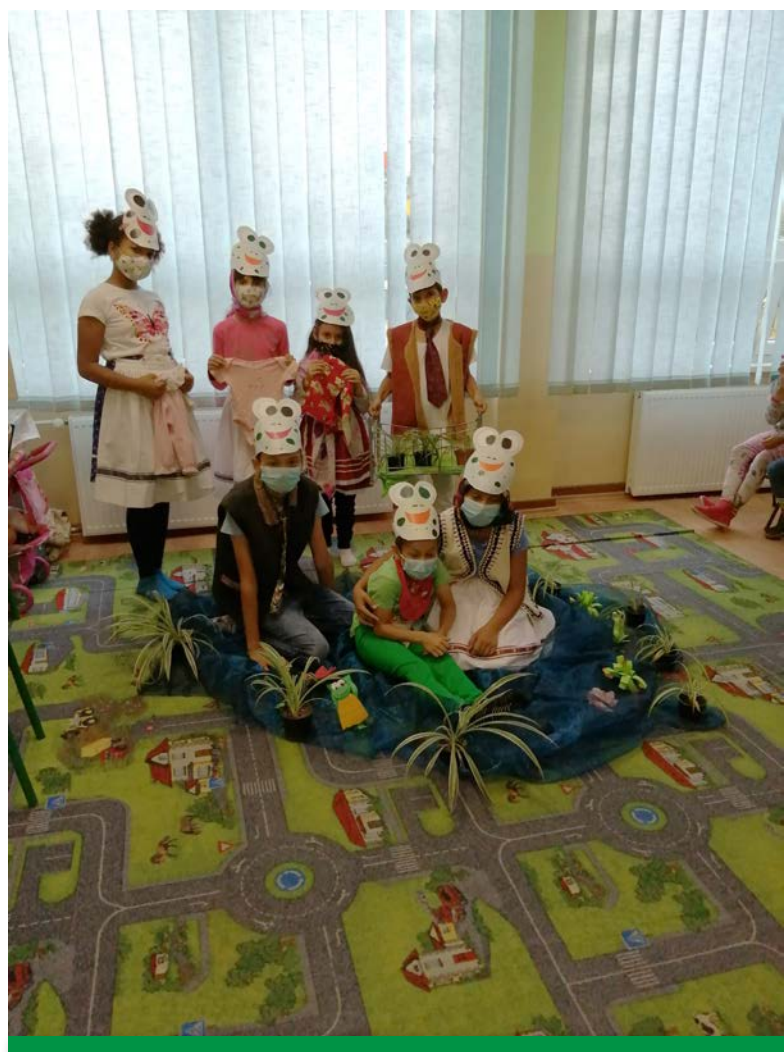
11. ročník česko-slovenského projektu Záložka do knihy spája školy: Radosť z čítania ukrytá vo veršoch básní alebo v próze (Základná škola v Mučíne)

vila powerpointovú prezentáciu patronátneho mesta Moravský Krumlov, ktorú si následne pozreli všetci žiaci spolu s triednymi učiteľmi. A aby prezentácia nebola samoučelná, ukryla v nej otázku, ktorú mohli žiaci zodpovedať a dostať sa do žrebovania o vecné ceny. Okrem mnohých zaujímavostí o spomínanom meste sa dozvedeli, ako vyzerá ich partnerská Základná škola na Kláštornom námestí v Moravskom Krumlove , koľko žiakov ju navštevuje a do akých zaujímavých aktivít sa zapájajú. V rámci 1. stupňa si žiaci rozdelili knihy požičané zo školskej knižnice. Napríklad prvákom učiteľka čítala knihu Gulko Bombulko , ktorý bol inšpiráciou pri zhotovovaní záložky. Ich spolužiaci z paralelnej triedy si po prečítaní rozprávky Drevený zámoček zahrali aj divadielko podľa prečítaného príbehu. Druháci si prečítali knihu od Ludmily Podjavorinskej Čin-Čin ,