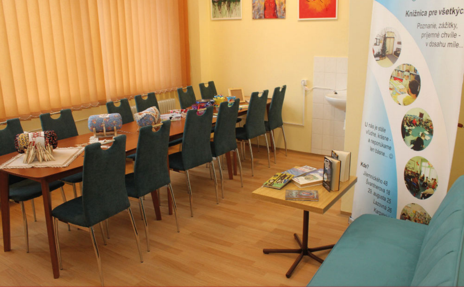
Nový Creativ club vo Verejnej knižnici Mikuláša Kováča

Verejná knižnica Mikuláša Kováča (VKMK) v Banskej Bystrici pôsobí ako regionálna (okresy Banská Bystrica a Brezno) a mestská knižnica (mesto Banská Bystrica). Založená bola v roku 1973 a od roku 2002 je zriaďovateľom Banskobystrický samosprávny kraj.