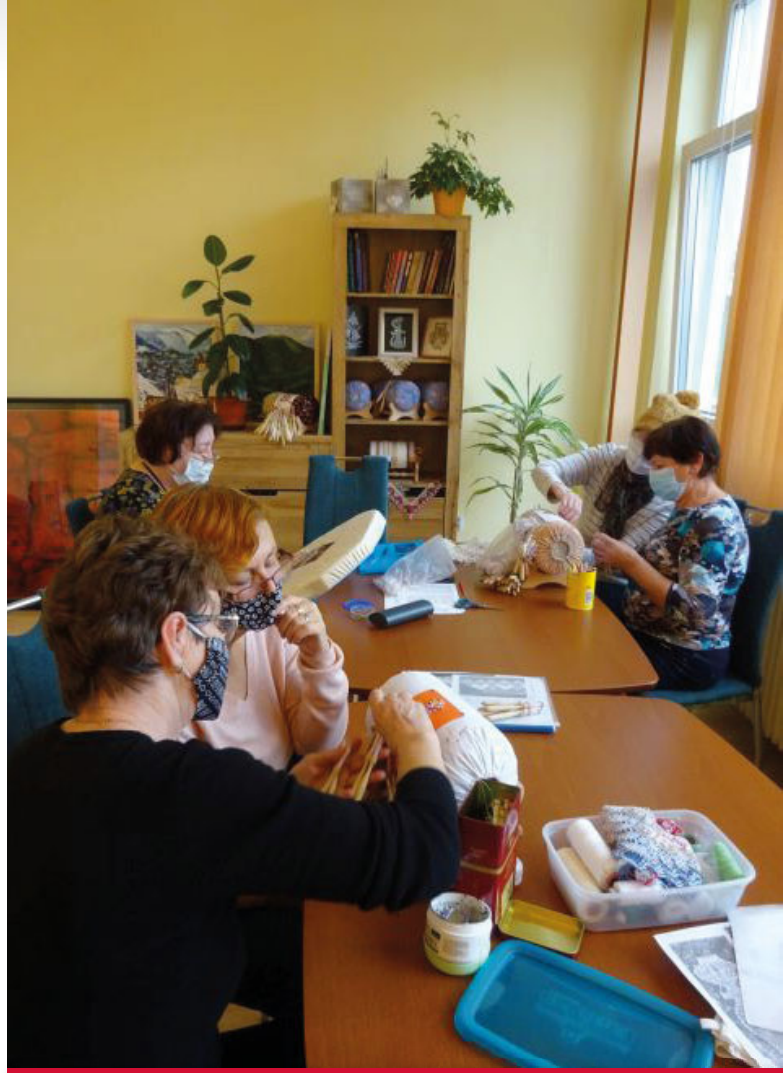
Kurz paličkovania v priestoroch Creativ clubu

V rámci realizácie projektu knižnica upravila a sfunkčnila nefunkčný priestor (miestnosť: 30 metrov štvorcových), ktorý účelovo a vkusne zariadila na opísaný účel. Priestor bol vymalovaný, do miestnosti bola položená vhodná podlahová krytina, nové svetidlá a okenné žalúzie. Zároveň bola vybavená a zariadená jednoduchým, hlavne účelným nábytkom (4 stoly, 15 stoličiek, 1 skriňa 1 policový regál, pohovka, konferenčný stolík). Priestor klubu je kreatívne a výtvarne dotvorený a ponúka možnosť realizovať aj minivýstavky výtvarných diel. Celý priestor