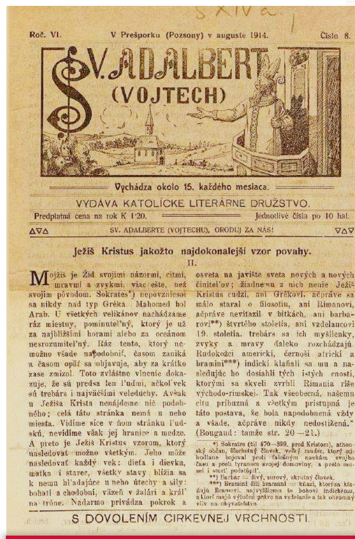
Posledné číslo časopisu