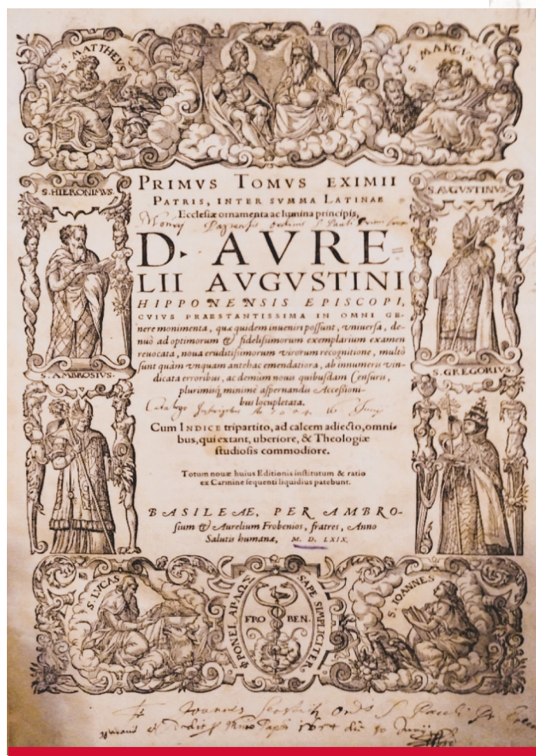
Obr. 1 Vyobrazenie sv. Augustína v prvom zväzku súborného diela sv. Augustína zo 16. storočia. Signatúra: svkbb-ZER 236