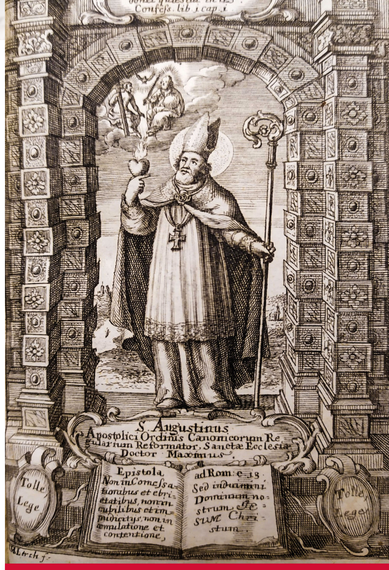
Obr. 3 Vyobrazenie sv. Augustína v diele Canonica Reformatio Hominis veteris, Per Decem dies zo 17. storočia. Signatúra: svkbbMS Ba BB 3930

Na ďalšej ilustrácii (Obr. 3) pozorujeme vyobrazenie sv. Augustína s legendou. Odkazuje na ňu nápis „Tolle, Lege“ po oboch stranách dolného okraja a v strede otvorená kniha s textom Listu Rimanom 13, 13 – 14. Augustín je tu znázornený s bradou a aureolou, poukazujúcou na jeho svätosť, a aj ako biskup s atribútmi: pluviál, mitra, berla a pektorál (kovový kríž okolo krku). V pravej ruke drží horiace srdce, ktoré symbolizuje Augustínovo obrátenie. Nad ním pozorujeme Svätú Trojicu a úryvok z prvej knihy jeho spisu Vyznania: „Stvoril si nás pre seba Pane a nespokojné je naše srdce, kým nespočinie v Tebe“. Ilustrácia sa nachádza na patitulnej strane tlače. V ľavej dolnej časti ilustrácie vidíme aj autorove iniciály: I. M. Lerch f.. Tlač obsahuje vybrané spisy viacerých autorov, medzi nimi aj sv. Augustína. Vydaná bola