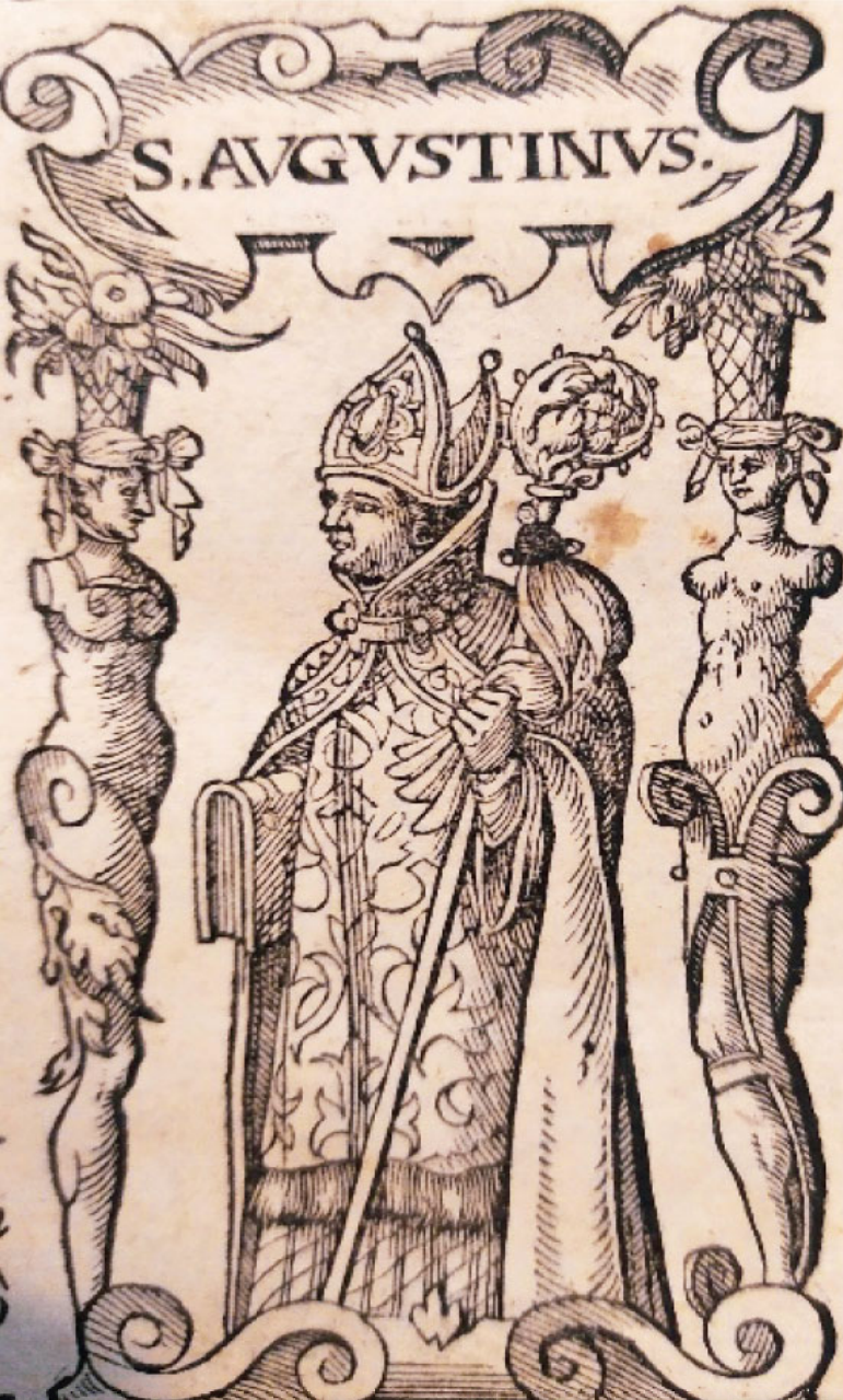
Obr. 2 Detail sv. Augustína

Na ďalšej ilustrácii (Obr. 3) pozorujeme vyobrazenie sv. Augustína s legendou. Odkazuje na ňu nápis „Tolle, Lege“ po oboch stranách dolného okraja a v strede otvorená kniha s textom Listu Rimanom 13, 13 – 14. Augustín je tu znázornený s bradou a aureolou, poukazujúcou na jeho svätosť, a aj ako biskup s atribútmi: pluviál, mitra, berla a pektorál (kovový kríž okolo krku). V pravej ruke drží horiace srdce, ktoré symbolizuje Augustínovo obrátenie. Nad ním pozorujeme Svätú Trojicu a úryvok z prvej knihy jeho spisu Vyznania: „Stvoril si nás pre seba Pane a nespokojné je naše srdce, kým nespočinie v Tebe“. Ilustrácia sa nachádza na patitulnej strane tlače. V ľavej dolnej časti ilustrácie vidíme aj autorove iniciály: I. M. Lerch f.. Tlač obsahuje vybrané spisy viacerých autorov, medzi nimi aj sv. Augustína. Vydaná bola