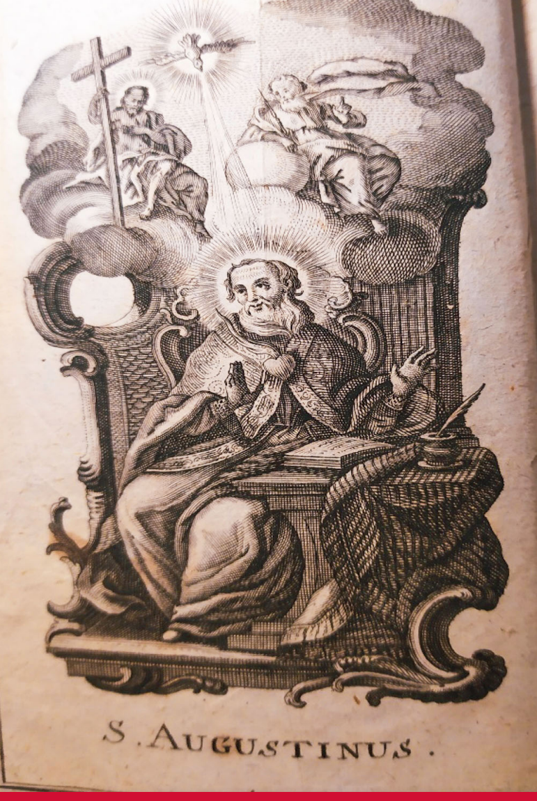
Obr. 4 Vyobrazenie sv. Augustína v diele Meditationes, soliloquia et manuale z 18. storočia. Signatúra: svkbbMS Ba BB 856 a svkbbMS Ba BB 5714

s bradou a aureolou. O pravé rameno sa mu opiera berla – atribút biskupa. Pred ním pozorujeme malú postavu anjela, čo by mohlo odkazovať na legendu, podľa ktorej Augustín počuje detský hlas, ktorý hovorí: „ Tolle, Lege “. Ilustrácia sv. Augustína sa nachádza na frontispice knihy. Vydaná bola v Innsbrucku vo vydavateľstve Libraria Academica Wagneriana v roku 1869.