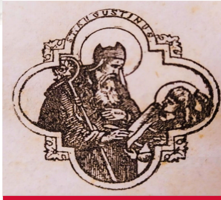
Obr. 5 Vyobrazenie sv. Augustína v diele De Catechizandis Rudibus z 19. storočia. Signatúra: svkbbMS Ba BB 3935

Vo Fonde starých a vzácných dokumentov Štátnej vedeckej knižnice v Banskej Bystrici je uložených pätnásť tlačí, ktorých autorom je sv. Augustín. Sú súčasťou seminárnej knižnice, ktorú má ŠVK BB v správe. Majiteľom je Biskupský úrad v Banskej