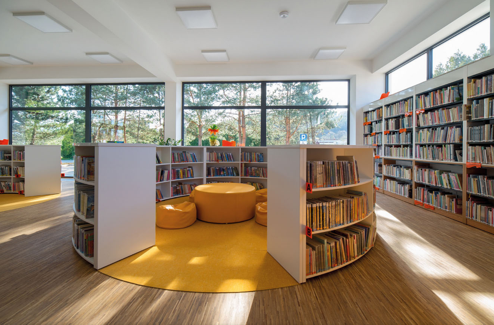
Rekonštrukcia knižnice Stary Sącz