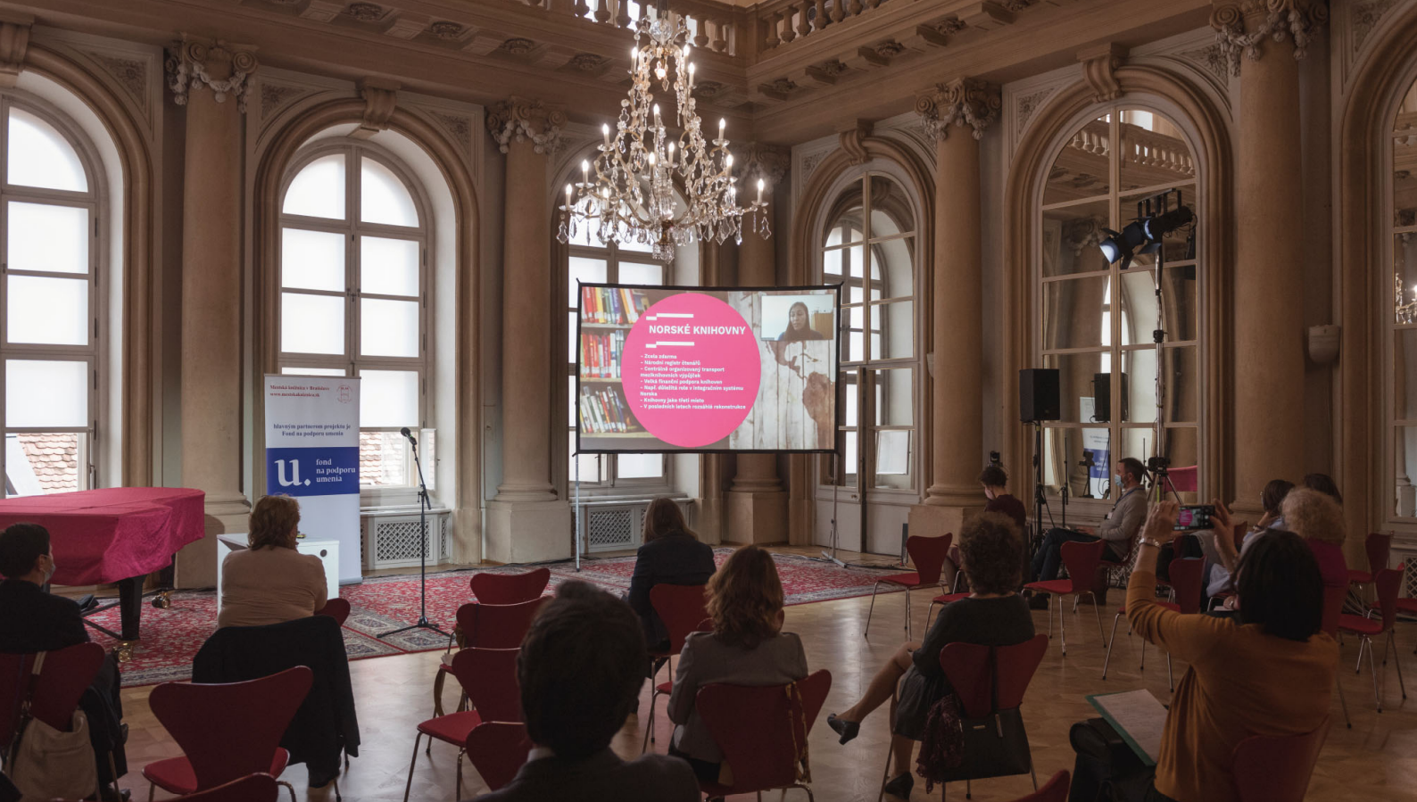
Seminár sa konal v Zrkadlovej sieni Primaciálneho paláca

Mestská knižnica v Bratislave si v tomto roku 2020 pripomína 120. výročie svojho založenia. Pri tejto príležitosti sa neohliada len späť do svojej bohatej histórie, ale prináša aj podnety pre budúcnosť – vlastnú i budúcnosť slovenských knižníc všeobecne.