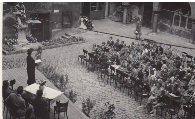
V roku 1938 MKB otvorila pobočku v Starej radnici

Kvalita hudobného fondu vyústila v roku 1964 do založenia samostatného Oddelenia hudobnej a umenovednej literatúry, ktoré tiež vzniklo ako prvé svojho druhu na Slovensku. Jeho dnešné sídlo na adrese Kapucínska 1 v roku 1991 slávnostne otvoril operný spevák Peter Dvorský. Ponúka 45 000 kníh a časopisov o umení a dizajne, noty a partitúry, ako aj zbierku LP a CD platní. V hudobnom štúdiu je pre