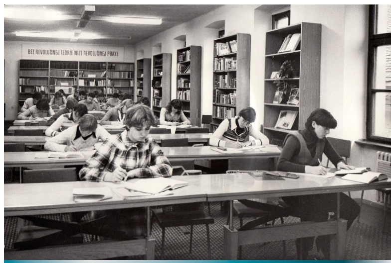
Študovňa na Klariskej

V roku 1979 sa budova na Klariskej ulici stala sídlom nielen Knižárskej dielne a riaditeľstva, ale aj Útvary literatúry marxizmu-leninizmu, v ktorom boli sústredené spisy a učebnice určené na štúdium povinných ideologických predmetov. Riaditeľstvo a dielňa tu sídlia dodnes, útvary politickej literatúry však hneď po revolúcii zanikol.