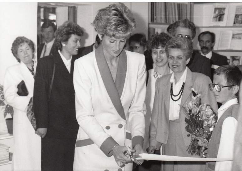
Princezná Diana otvára Oddelenie pre nevidiacich a slabozrakých, 1991

Ľuďom, ktorí majú problém s čítaním klasických kníh, slúži Oddelenie pre nevidiacich a slabozrakých. Oddelenie slávnostne otvorila 8. mája 1991 Diana, Jej kráľovská výsosť princezná z Walesu, ktorá mu darovala prvú čítaciu lupu. Špecializované oddelenie vzniklo pre potreby ľudí so zrakovým znevýhodnením, postupom času svoju pôsobnosť rozšírilo a od roku 2011 poskytuje služby každému, kto nemôže čítať klasické knihy – ľuďom po mozgovej príhode, s epilepsiou, s poruchami učenia, dyslexiou či autizmom. Nachádzajú sa tu dokumenty v Braillovom písme, rôzne pomôcky a zvukové knihy. Špeciálne čítacie lupy, ktoré text priblížia či zobrazia vo výraznom kontraste, oceňujú aj seniori a seniorky. Oddelenie ponúka tiež spoločenské hry pre nevidiacich, kino s audiokomentárom, očné jogu a iné aktivity. Je dostupné bezbariérové a nevidiacich naviguje pri vstupe zvukový maják.