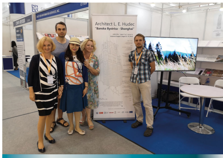
Prezentácia na knižnom veľtrhu BIBF 2019 v Pekingu

2019, ale aj v Spojenom ústave jadrového výskumu v ruskom meste Dubna v rámci Galafestivalu českej a slovenskej kultúry a na Pekinskom medzinárodnom knižnom veľtrhu 2019 (Beijing International Book Fair, BIBF) v stánku Slovenskej republiky.