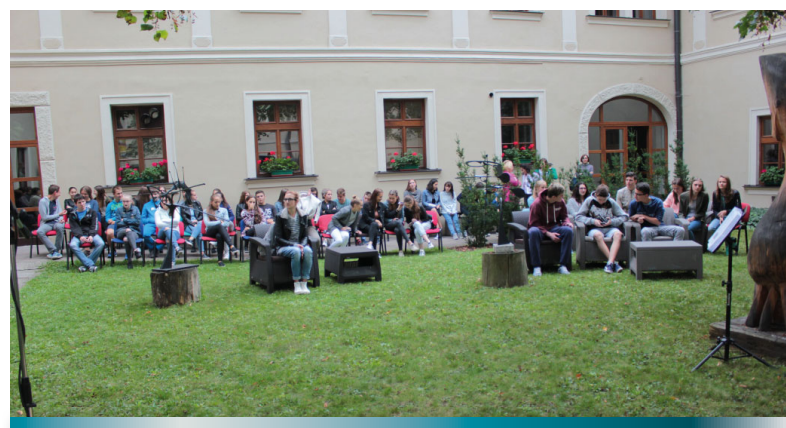
Podujatie Dotknite sa kultúrneho dedičstva , 2016

S cieľom učiť sa a svojich používateľov, ako sa správať ekologicky vo vzťahu k móde, sa knižnica zapojila aj do zbierky oblečenia na podporu projektu OZ Šumné a pripravila vzdelávaciu prednášku o tomto projekte.