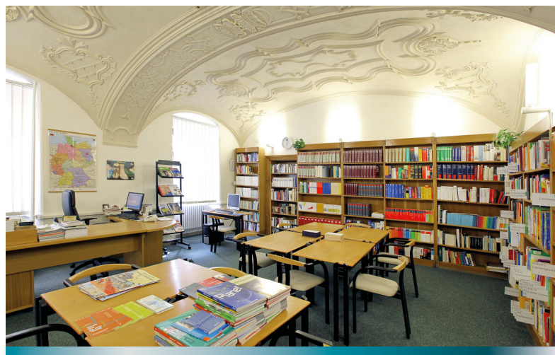
Nemecká študovňa – interiér

Po roku 2000 sa začala v Štátnej vedeckej knižnici v Banskej Bystrici budovať sieť jazykových centier. Po Nemeckej študovni, ktorá bola zriadená už v roku 1994, postupne vzniklo Centrum ruských štúdií, neskôr transformované na Centrum slovanských štúdií, centrum InfoUSA, ktoré pôsobí od roku 2020 pod novým názvom American Centre, Britské centrum a ako jediné na Slovensku aj centrum Window of Shanghai.