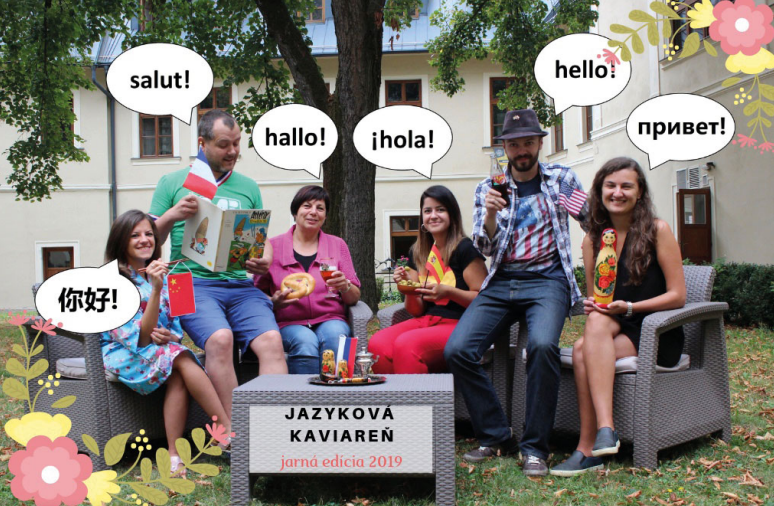
Upútavka na podujatie Jazyková kaviareň v roku 2019

Knižnica je významným organizátorom odborných podujatí pre knihovnícku verejnosť na celoslovenskej i medzinárodnej úrovni.