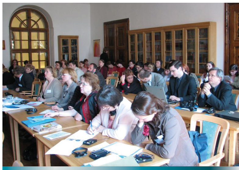
Prvé kolokvium knižnično-informačných špecialistov krajín V4 v roku 2005

Okrem toho sa pravidelne zúčastňuje na významnom odbornom fóre SILF ( Shanghai International Library Forum ), ktoré sa koná každé dva roky v Šanghaji v partnerskej Šanghajskej knižnici.