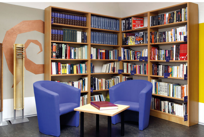
Interiér Štátnej vedeckej knižnice v Banskej Bystrici – Hudobné átrium

Po roku 1970 prešla knižnica mnohými zmenami, či sa to týkalo odborného vzdelávania, technologického rozvoja a technického vybavenia, rekonštrukcie priestorov knižnice, ich zariadenia alebo vyriešenia skladových priestorov. V súčasnosti má knižnica najrozsiahlejší fond zvukových a audiovizuálnych dokumentov, hudobnín a hudobnej literatúry a jediný fond geologickej literatúry v rámci SR.