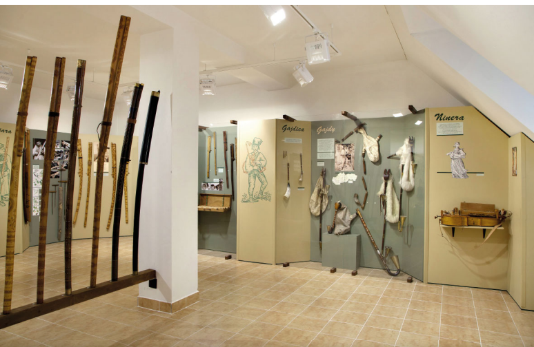
Expozícia Literárneho a hudobného múzea

zeám na Slovensku i v Európe. V múzeu sa nachádza najväčšia zbierka ľudových hudobných nástrojov na Slovensku a tiež výnimočná zbierka tradičného bábkového divadla. Obidve zbierky boli prezentované aj v zahraničí – v Bulharsku, Ruskej federácii, Srbsku, Bielorusku, Číne a ďalších krajinách. Múzeum sa zameriava na dokumentáciu literárnej a hudobnej kultúry a osobností regiónu Banská Bystrica a Brezno.