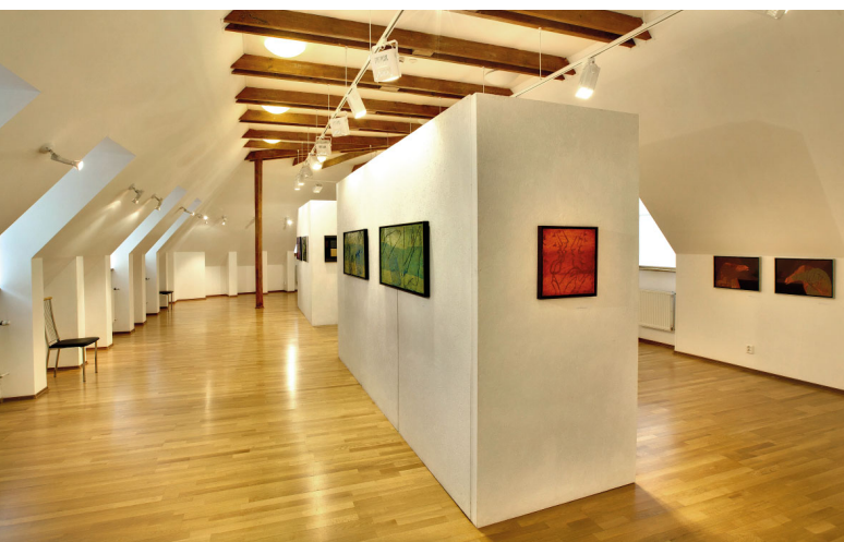
Galéria v podkroví

Ďalším prínosom pre kultúrny život návštevníkov knižnice je Galéria v podkroví, kde sú vystavené diela renomovaných slovenských aj zahraničných výtvarných umelcov. Zo slovenských výtvarníkov sú tu verejnosti sprístupnené diela Miroslava Cipára, Milana a Mariána Ormandíkovcov, Drahomíra Príhela, Ferdinanda Hložníka, Ondreja Zimka či Miliny Zimkovej.