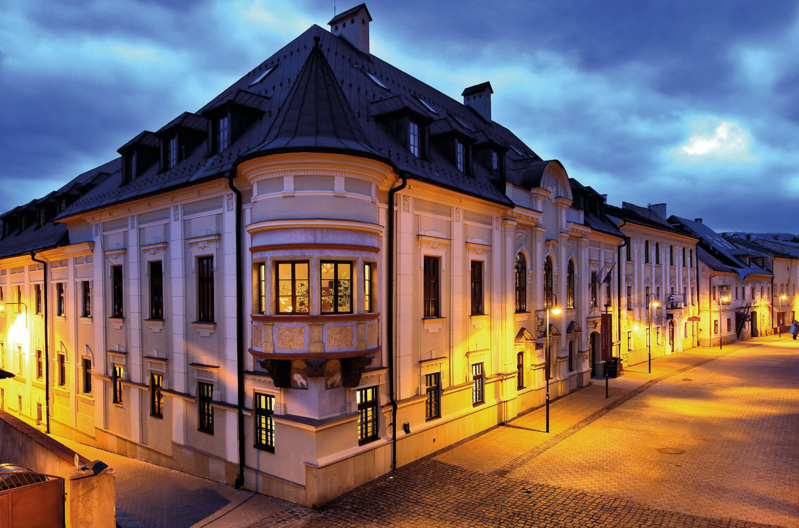
Hlavná budova Štátnej vedeckej knižnice v Banskej Bystrici, Lazovná 9

Cesta k získaniu štatútu vedeckej knižnice dnešnej Štátnej vedeckej knižnice v Banskej Bystrici nebola jednoduchá. Bola kľukatá, neraz poznačená márnymi snahami, no napokon ovenčená úspechom v podobe uznania jej kvalít a získania významného postavenia hodného vedeckej knižnice.