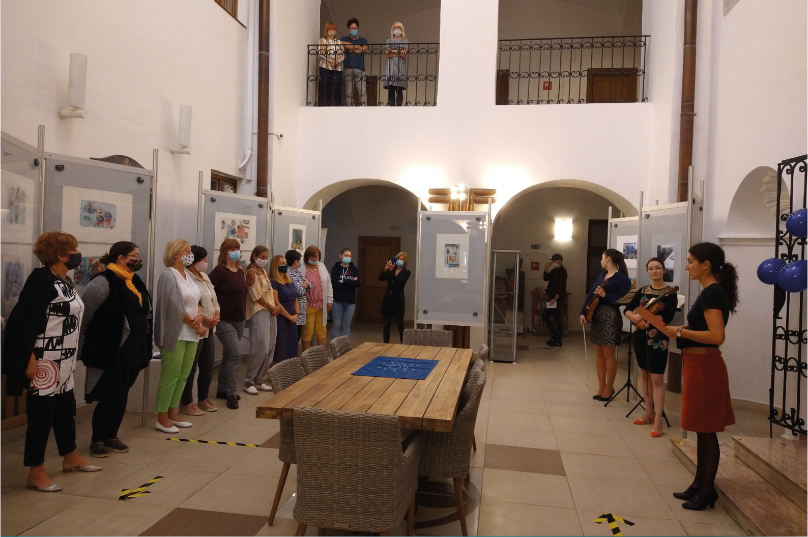
Otvorenie Dní európskeho kultúrneho dedičstva, 2020

Pracovníci knižnice realizujú množstvo podujatí a projektov, ktorými chcú pritiahnúť verejnosť do knižnice a ponúknuť jej zmysluplné trávenie voľného času. Či už sú to aktivity pre mladšie deti a žiakov, tvorivé dielne, workshopy, poznávacie podujatia, exkurzie alebo tréningy pamäti pre seniorov.