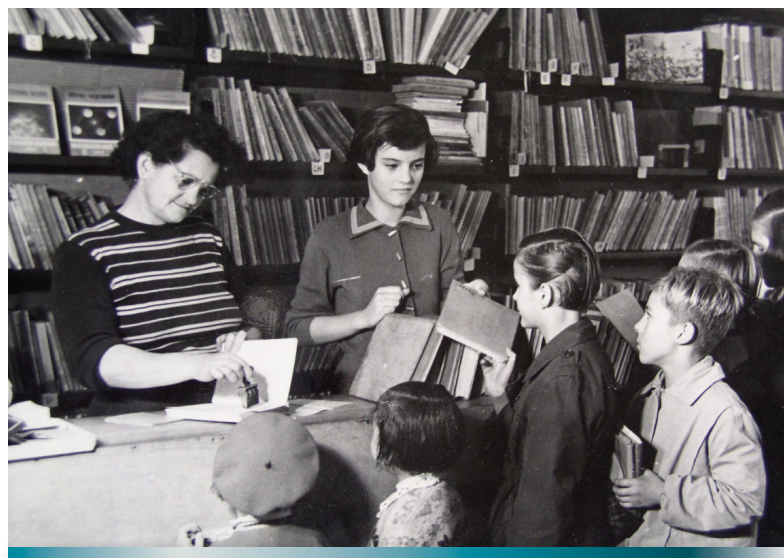
Požičovňa na Fučíkovej ulici, 1952

V tomto období zaznamenala knižnica prudký rozvoj, o čom svedčí fakt, že v rokoch 1954 – 1968 vybuďovala v Banskej Bystrici a priľahlých obciach svoje pobočky. V roku 1957 mala štyri pobočky 4 a do roku 1968 zriadila a vybuďovala spolu 14 pobočiek. 5 Aj keď Slovenská knižničná rada na svojom zasadnutí 26. apríla 1961 prerokovala, skoncipovala a schválila návrh štatútu budúcej vedeckej knižnice, podmienky na jej ustanovenie ešte neboli vytvorené. 6 Chýbali najmä priestory a odborní pracovníci.