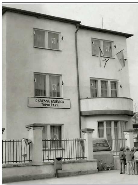
Budova Okresnej knižnice v Topolčanoch